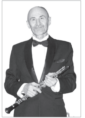
Қали Байжанов атындағы концерттік бірлестіктің ұжымы