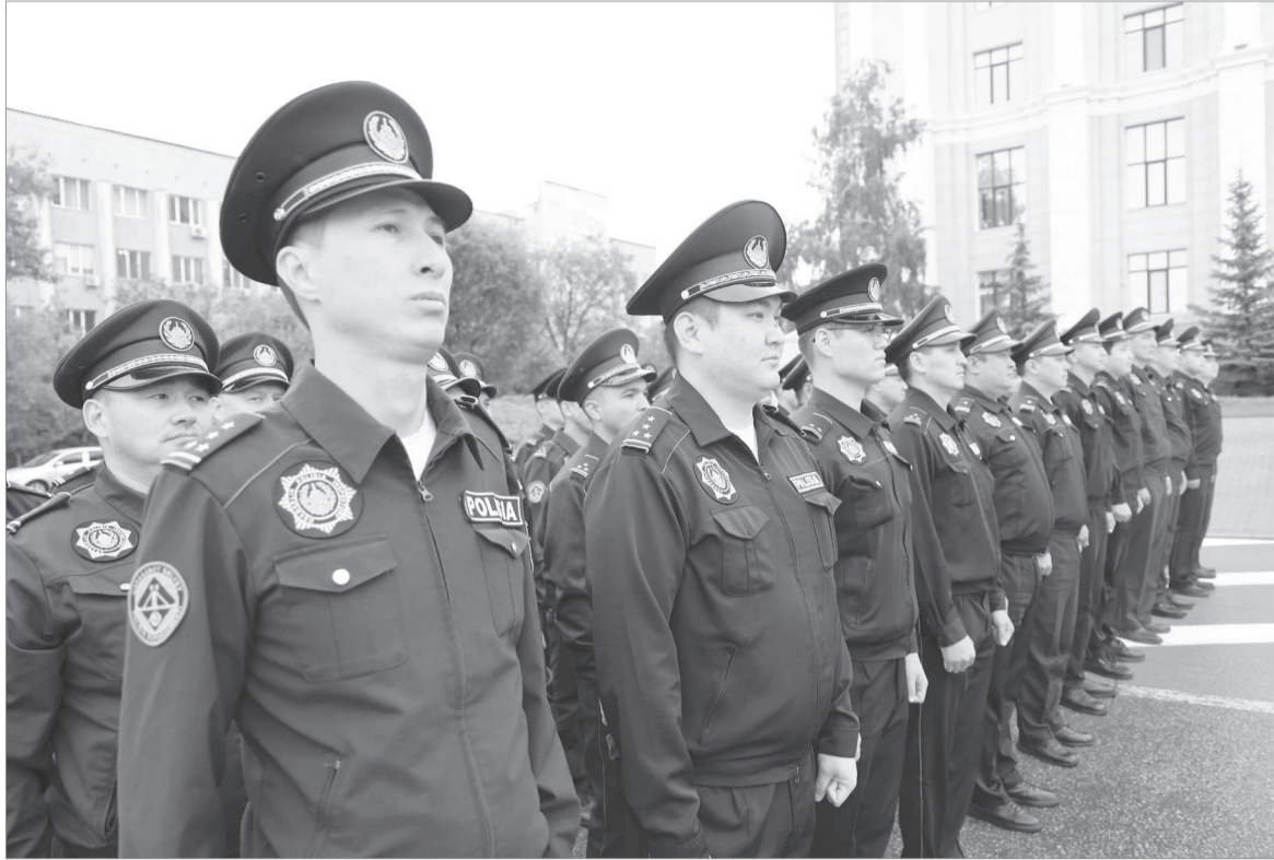
(Соңы. Басы 1-бет)

Өтініш несінің айтуынша, бір жылдан астам уақыт бойы шешімін таппай келген іс тәжірибелі тергеушінің кәсібилігі мен жауапкершілігінің арқасында оң нәтижеге қол жеткізген. Автор өз хатында тергеушінің істің мән-жайын мұқият зерттеп, жедел әрі сауатты шешім қабылдағанын атап өткен. Сонымен қатар, полиция бөлімінің ұжымдық жұмысы мен басшылықтың қызметті тиімді ұйымдастыруына ризашылығын білдірген. Мұндай пікірлер құқық қорғау органдары жұмысының басты көрсеткіші статистика ғана емес, азаматтардың сенімі мен ризашылығы екенін айқын аңғартады.