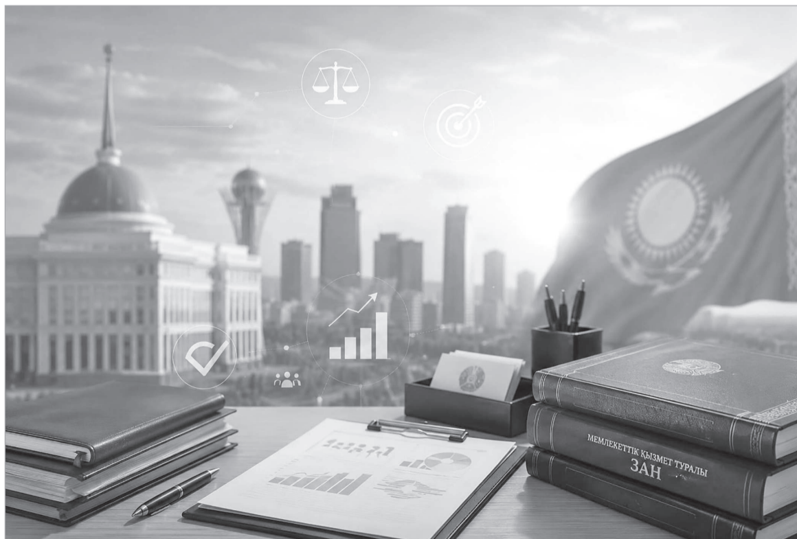
Коллаж: жасаған Шаһир Алашбаева

қолға алынған өзгерістердің түпкі мақсаты – әділетті, тиімді және халыққа жақын мемлекеттік аппарат қалыптастыру. Осы бағыттағы маңызды қадамның бірі – жақында қабылданған жаңа редакциядағы «Мемлекеттік қызмет туралы» Заң. Мұнда 2024-2029 жылдарға арналған мемлекеттік қызметті дамыту тұжырымдамасын жүзеге асыру мақсатында әзірленген. Негізгі идеясы – мемлекеттік қызметтің жаңа мәдениетін қалыптастыру. Бүгінгі күннің мемлекеттік қызметшісі кабинетте отырып бұйрық беретін шенеунік емес. Ол – қоғаммен ашық диалог жүргізетін, халықтың сұранысын ескеретін, нақты нәтижеге жұмыс істейтін кәсіби маман. Жаңа заңда алғаш рет мемлекеттік қызметтің миссиясы нақты белгіленді. Қоғам дамыған сайын мемлекеттік қызметке қойылатын талап та арта түседі. Бүгінде кәсіби біліммен қатар адалдық, ашықтық,