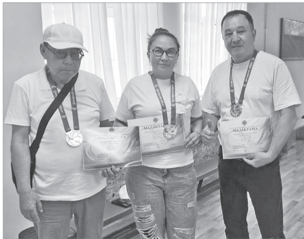
Өз тілшімізден

нен (қазақ күресі, шағын футбол, баскетбол, тоғызқумалақ, шахмат, үстел теннисі, жүзу, волейбол, гир тасын көтеру) күш сынасты. Екі күнге созылған сайыстың барысында Қарқаралы командасы спорттық серік еткендерін іспен дәлелдеп, бірінші орынды жеңіп алды.