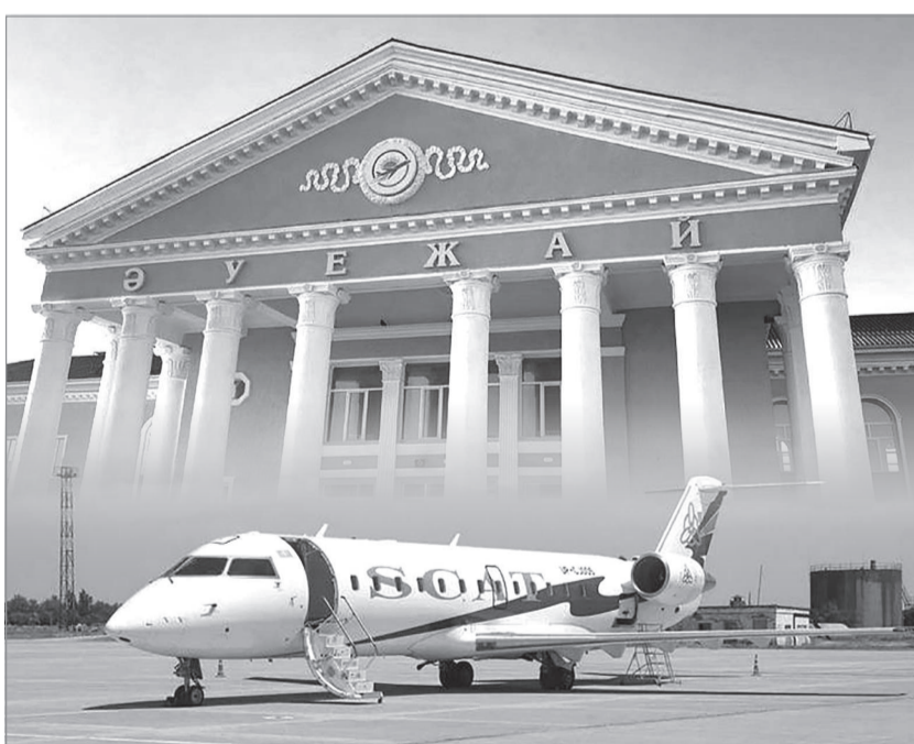
Сурет облыс әкімінің сайымынан

– Екі жарым жылға созылған құрылыс жұмыстары барысында әуеай-