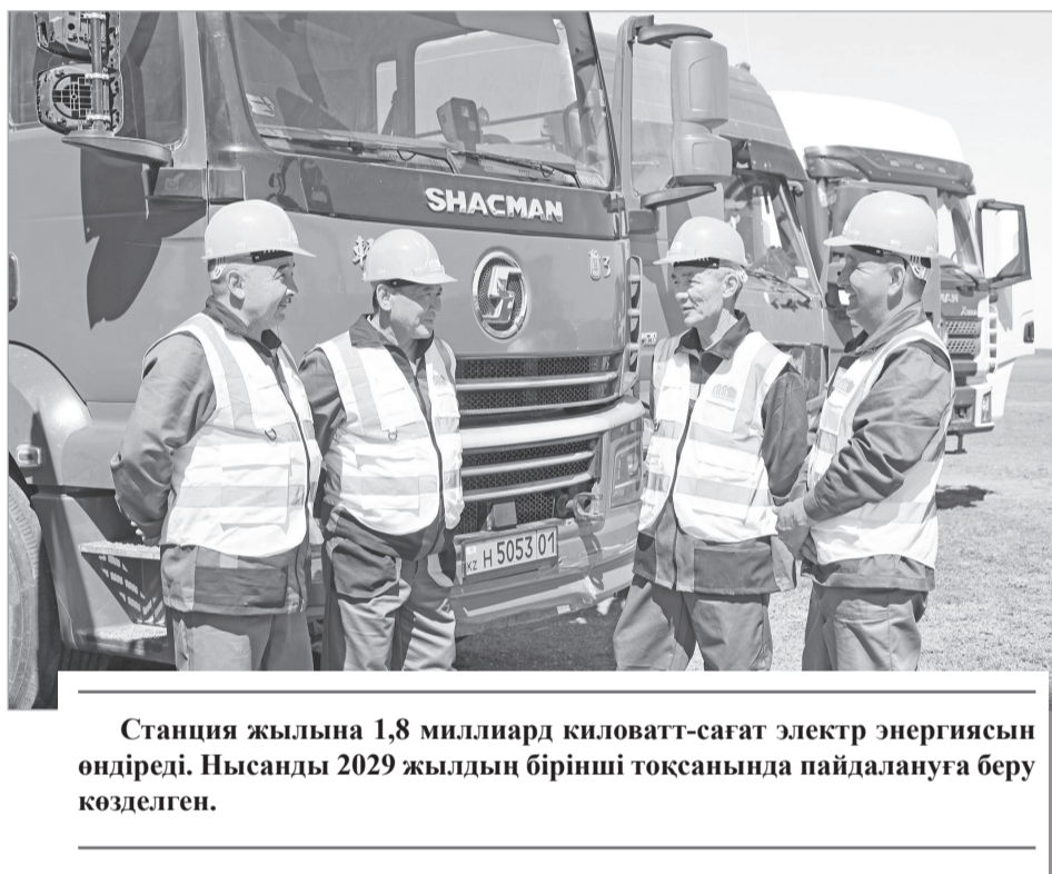
Станция жылына 1,8 миллиард киловатт-сағат электр энергиясын өндіреді. Нысанды 2029 жылдың бірінші тоқсанында пайдалануға беру көзделген.