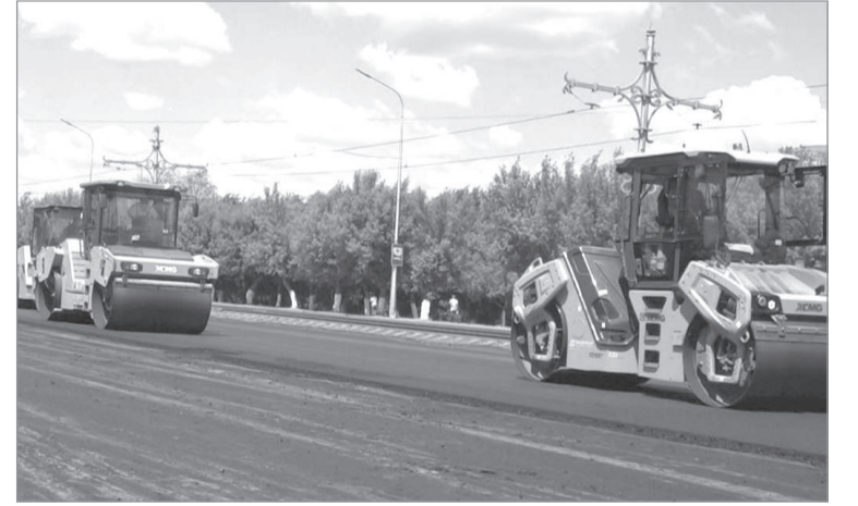
Ержан ИМАШ, «Ortalyq Qazaqstan»

Теміртау қаласы әкімінің биылғы белгіленген жоспары бойынша осындағы көшелер мен даңғыл жолдарының 16,5 шақырымы орташа жөнделетін болса, соның 2,6 шақырымының жұмыстары басталып та кетті.