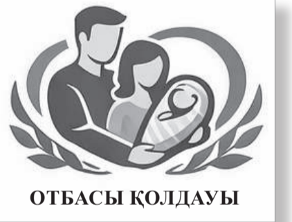
«Ел болам десең, бесігінді түзе!» Мұхтар Әуезов

басынан бері орталыққа 1358 адам жүгінген. Оның ішінде 32 өтініш ресми тіркеліп, 86 адамға психологиялық кеңес берілген. Заңгерлік көмек 93 адамға көрсетілсе, медиатор көмегіне 42 адам жүгінген. Сонымен қатар қиын өмірлік жағдайға тап болған азаматтарға құжат рәсімдеу, жұмысқа орналастыру, алимент өндіру мәселелерінде нақты қолдау көрсетілген. Әсіресе, алимент өндіру мәселесі қоғамдағы өзекті проблеманың бірі болып тұр. Орталыққа жүгінген 1052 азаматтың өтініші бойынша жалпы көлемі 196 миллион теңге алимент өндірілген.