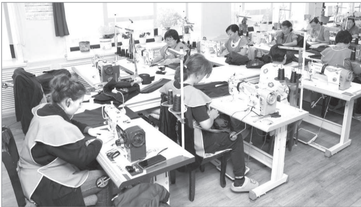
Сурет облыс әкімінің сайынан

Облыста жыл басынан 860-тан астам мүмкіндігі шектеулі жан жұмыспен қамтылып, еңбек нарығына тартылды. Одан бөлек, биыл өңірде мүгедектігі бар азаматтарға арналған жұмыс орындарының квотасы 291-ге дейін ұлғайтылған. Алайда, өңір басшылығы бұл көрсеткішпен тоқтамай, мүмкіндігі шектеулі азаматтарды жұмыспен қамтуды жаңа деңгейге көтеруді көздеп отыр.