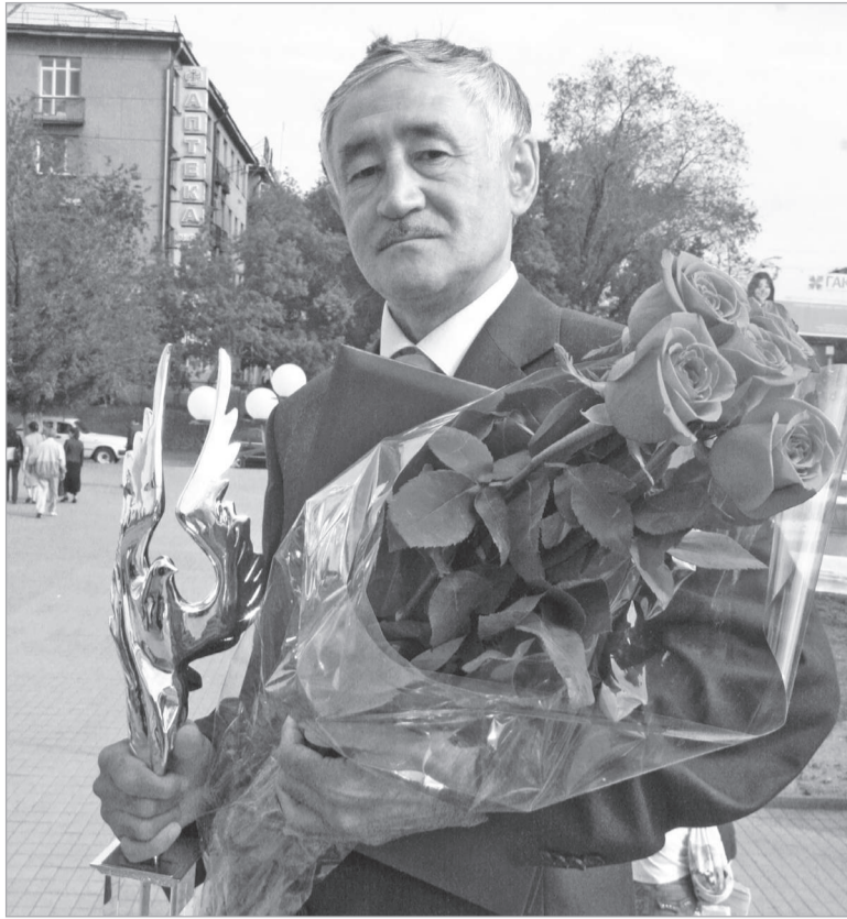
2009 жылы облыс әкімінің «Алтын сұңқар» сыйлығын алған сәт