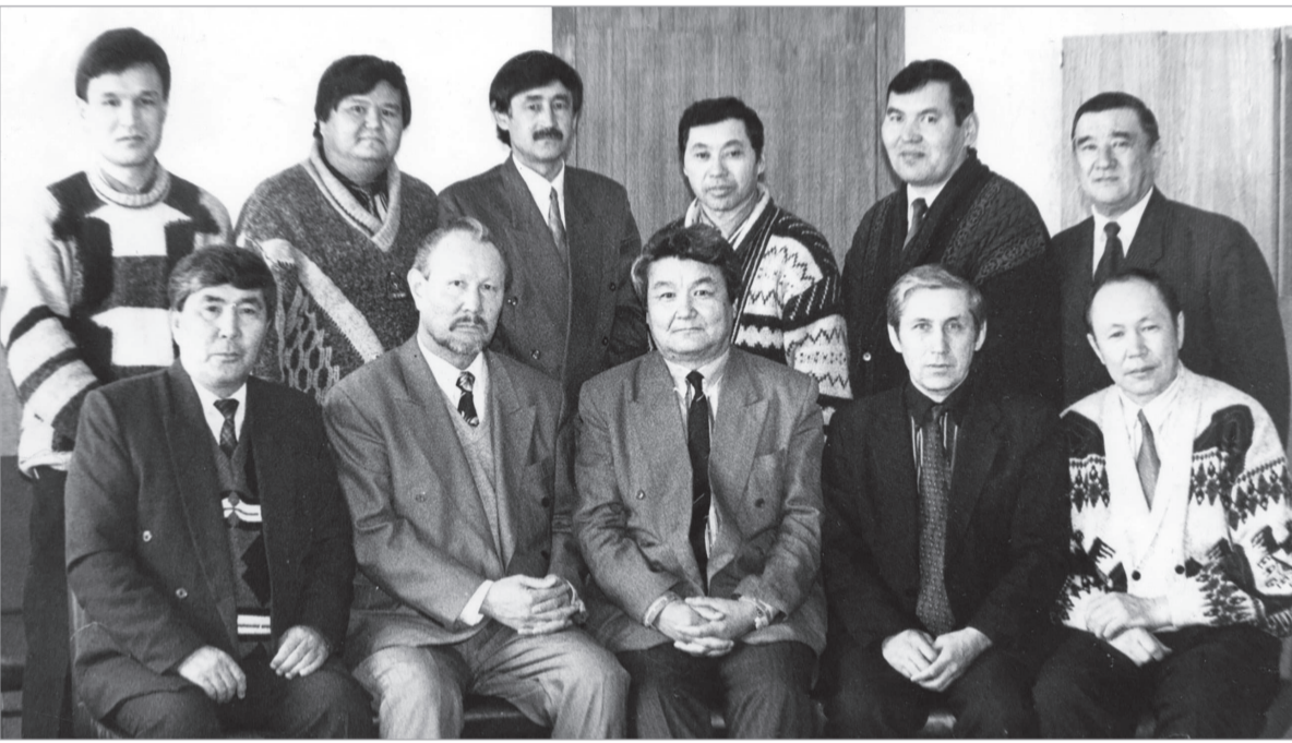
1997 жылы жазушы Акселеу Сейдімбекпен редакциядағы кездесу

бен шахмат ойнап, домбырасын тартып, бір мәре-сәре болатынбыз.