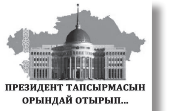
ПРЕЗИДЕНТ ТАПСЫРМАСЫН ОРЫНДАЙ ОТЫРЫП...

Ауылдық жерлердегі медицина саласының басты мәселесінің бірі – білікті кадр тапшылығы. Бұл, әсіресе, шалғай елді мекендерде айқын сезіледі. Мемлекет басшысы Қасым-Жомарт Тоқаев ауылдық жерлердегі денсаулық сақтау жүйесін дамыту мен медициналық инфрақұрылымды жаңғыртудың маңыздылығын ерекше атайды. Осы бағытта жүзеге асырылып келе жатқан «Дипломмен ауылға» бағдарламасы ауылдық денсаулық сақтау жүйесін нығайтуда маңызды құралға айналды. Қарағанды облысында да бұл жоба өз тиімділігін көрсетіп, нақты нәтижелер беруде.