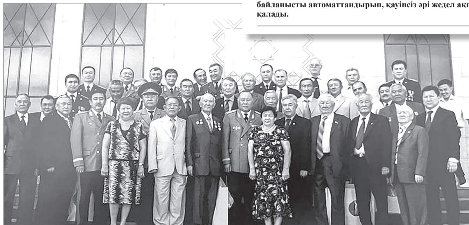
Генерал-майор Әубәкір Арыстанбековтің 100 жылдық мерейтойында.

1969 жылы Қытаймен арадағы қарым-қатынастың шиеленісіп, Қазақстан аумағында шекаралық қауіпсіздікті күшейту талап етілгенде шекаралық жасақтың байланыс жүйесін қамтамасыз ету – аса маңызды стратегиялық міндетке айналды. Сәбет Жақыпбеков басшылық еткен бөлімше одақтас республикалар арасында алғашқылардың бірі болып ведомстволық жедел байланысты автоматтандырып, қауіпсіз әрі жедел ақпарат алмасудың негізін қалады.