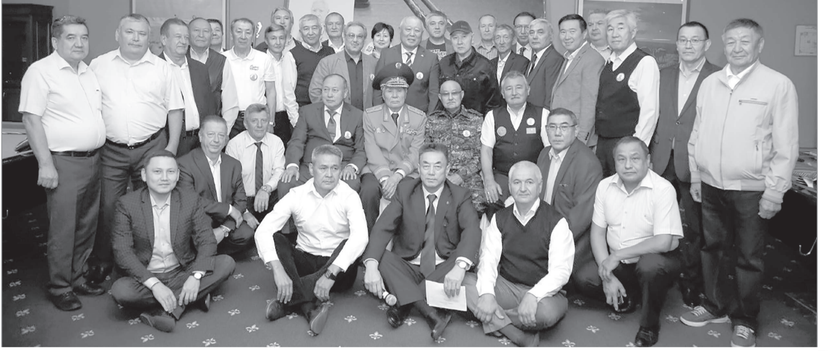
С.Жақыпбеков атындағы бильярд турниріне қатысушылар. 2020 жыл. Алматы.

стың шиеленісіп, Қазақстан аумағында шекаралық қауіпсіздікті күшейту талап етілгенде шекаралық жасақтың байланыс жүйесін қамтамасыз ету – аса маңызды стратегиялық міндетке айналды. Сәбет Жақыпбеков басшылық ет-