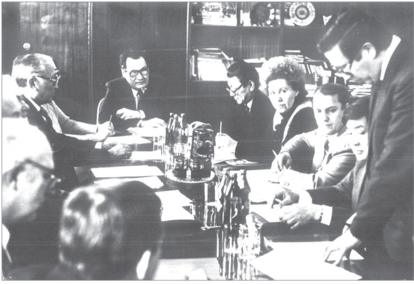
Ғылыми кеңес отырысы, 1982 жыл

Ғылым мен ғылым айдынында даңқы мен дара жолы бөлек Қарағандыдағы қара шаңырақ – Қарағанды техникалық университеті ғалымдарының тың ойлары озық технологияларға жол ашты. Ғылыми кеңестерде келешек үшін келелі мәселелер қозғалды, олар шешімін тауып, өмірге дендеп енді.