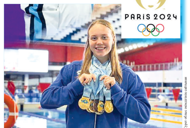
Сурет облыс әкімінің сапалы

Бір айта кетерлігі, 2 тамыз күні Саран қаласының тумасы,