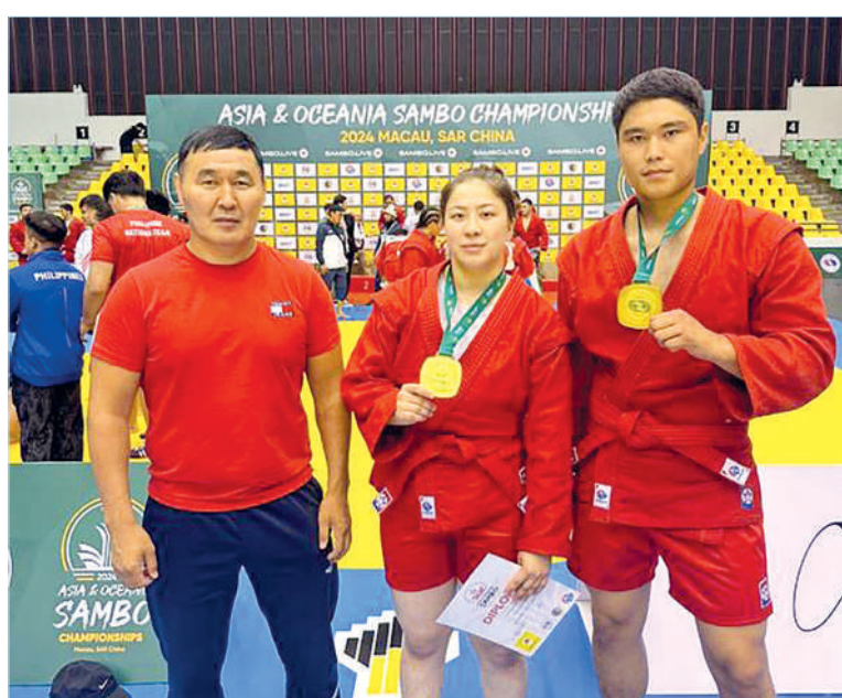
Сурет облыс әкімінің сапалы

– Биыл Макао сияқты Шығыс Азия аймағында Азия және Океания чемпионатын өткізу арқылы