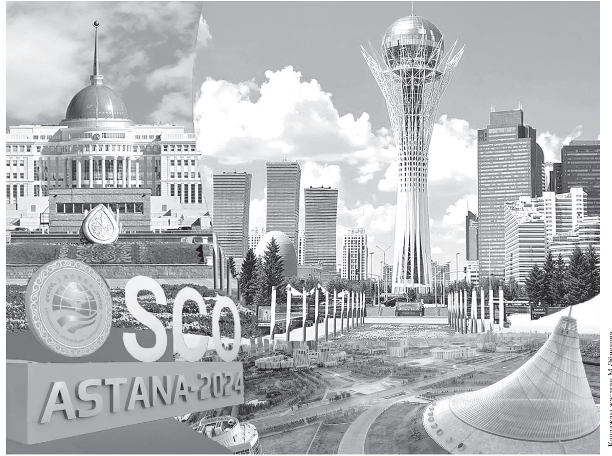
Коллажы жасаған М. Әбішев

– Бүгінде әлем бұрын-соңды болмаған геосаяси қайшылықтар мен қақтығыстардың күшеюіне байланысты туындаған күрделі сынақтармен бетпе-бет келіп отыр. Халықаралық қауіпсіздіктің архитектурасына қауіп төніп тұр.