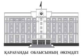
ҚАРАҒАНДЫ ОБЛАСЫНЫҢ ӘКІМДІГІ

Елімізде шілде айының алғашқы жексенбісінде Ұлттық домбыра күні тойланады. Биыл бұл мәні бөлек мейрам 7 шілдеге келіп тұр. Сонымен, 5 шілдеде Сәкен Сейфуллин атындағы Қарағанды облыстық академиялық қазақ драма театрында атаулы күн аясында «Ортеке» республикалық этно-фестивалі өткізілімек. Мақсат – қазақ халқының төл шығармашылығын кеңінен насихаттау. Өнер фестиваліне Қытай, Моңғолия елдерінен, Астана, Алматы қалалары мен Қызылорда, Батыс Қазақстан, Солтүстік Қазақстан, Қостанай облыстарының атынан 19 қатысушы ат басын тірейді деп күтілуде. Бағдарлама шеңберінде Қарағанды экономикалық университетінің конференц-залында ЮНЕСКО өкілдерінің қатысуымен материалдық емес мәдени мұраға қатысты республикалық семинар өтеді. Мереке күнінде орталық мәдениет және демалыс саябағында облыстың музыка мектептерінің оқушылары мен мәдениет үйлерінің өкілдері, ауылдық клубтар жанындағы домбыра