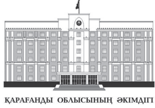
ҚАРАҒАНДЫ ОБЛАСЫНЫҢ ӘКІМДІГІ

Облыс полициялеріне су жана 200 қызметтік көлік берілді. Облыстық бюджет есебінен алынған көліктердің барлығы – отандық өнім. Жаңа техникаларды аймақ басшысы Ермағанбет Бөлекпаев өзі тапсырды.