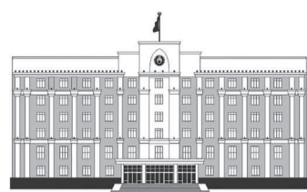
ҚАРАҒАНДЫ ОБЛЫСЫНЫҢ ӘКІМДІГІ

– Бүгінде «Киров» шахтасында 500-ден астам адам жұмыс істейді. Қазір жұмыста 119к12