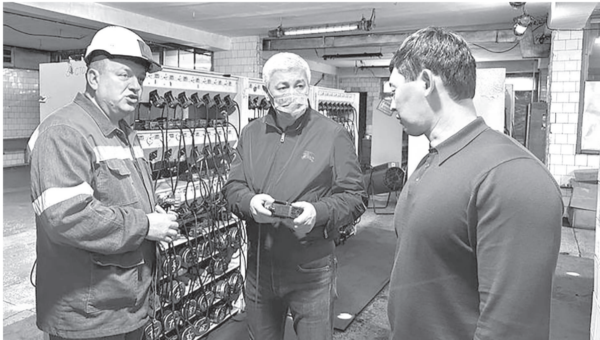
Сурет: аймақтық сайыптан