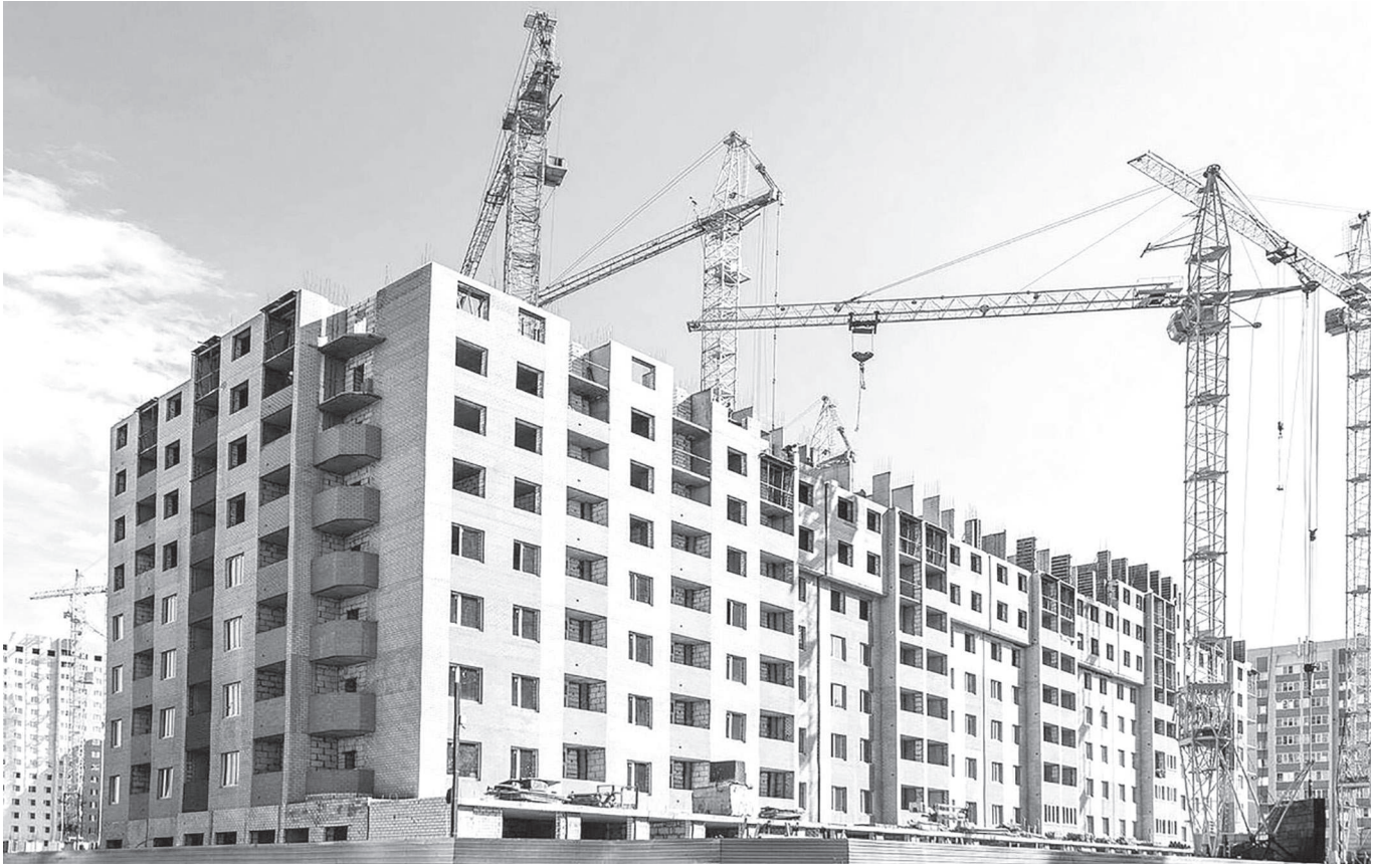
(Соңы. Басы 1-бетте)