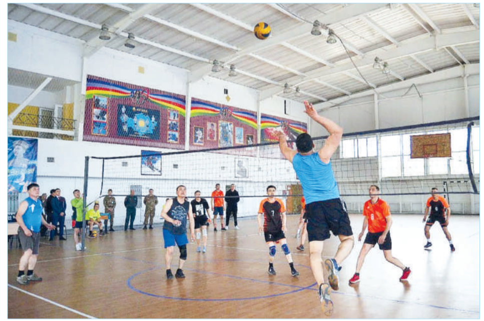
Өз тілшімізден

Ал, «Астана» өңірлік қолбасшылығы II орынға, III орынға «Орталық» аймағының әскери прокуратурасы ие болды. Жеңімпаздарды «Орталық» өңірлік қолбасшылығының қолбасшысы, генерал-майор Сәкентай Шекарбеков, Орталық аймағының әскери прокуроры полковник Данияр Жұмәділов пен «Астана» өңірлік қолбасшылығының қолбасшысы полковник Ержан Ибраев марапаттап, Отан қорғаушылар күні һәм Ұлы Жеңіс күнімен құттықтады. Мұндай спорт бәсекесі сарбаздардың рухын көтеріп, өзара татулыққа, ынтымаққа жетелейді.