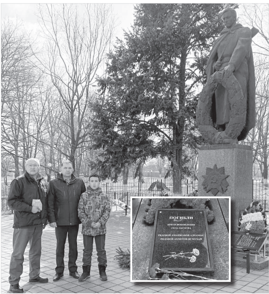
Сурет ұрпақтарының жеке мұрағатынан