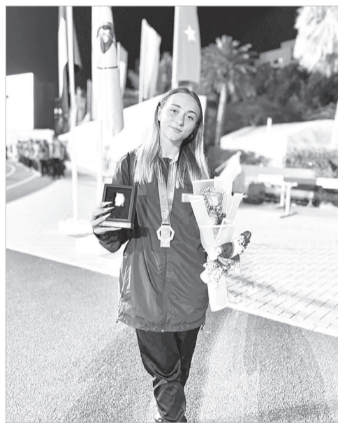
Сурет облыс әкімінің сайынан