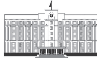
ҚАРАҒАНДЫ ОБЛАСЫНЫҢ ӘКІМДІГІ

ауылындағы үйлерін су басқан тұрғындарды көмірмен қамтамасыз ету басталып та кеткен.