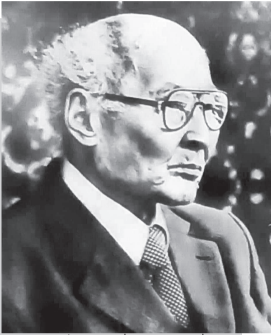
Академиктің соңғы суреті