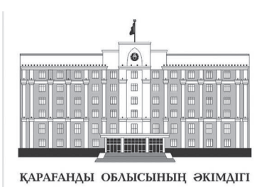
ҚАРАҒАНДЫ ОБЛЫСЫНЫҢ ӘКІМДІГІ

тұрғындары шығынды өтеуге қатысты алаңдаулы. Тасқын зардабы тиген әрбір адамға көмек көрсетіледі. Ешкім ескерусіз қалмайды. Барлық шығын нақты есептеледі және өтеледі. Ақсу және Қайрақты ауылдарында комиссия жұмысын аяқтауға жақын қалды. Келесі кезекте – Дерісалы және Красная поляна ауылдары. Мәңгілік елдері тұрғын үй құжаттарын ұсынуды керек. Төрт тұлға мал да тіркелген болуы тиіс. Егер, үйлер жарамсыз деп танылса, жаналары салынады немесе қайталама нарықта тұрғын үй сатып алу мүмкін-