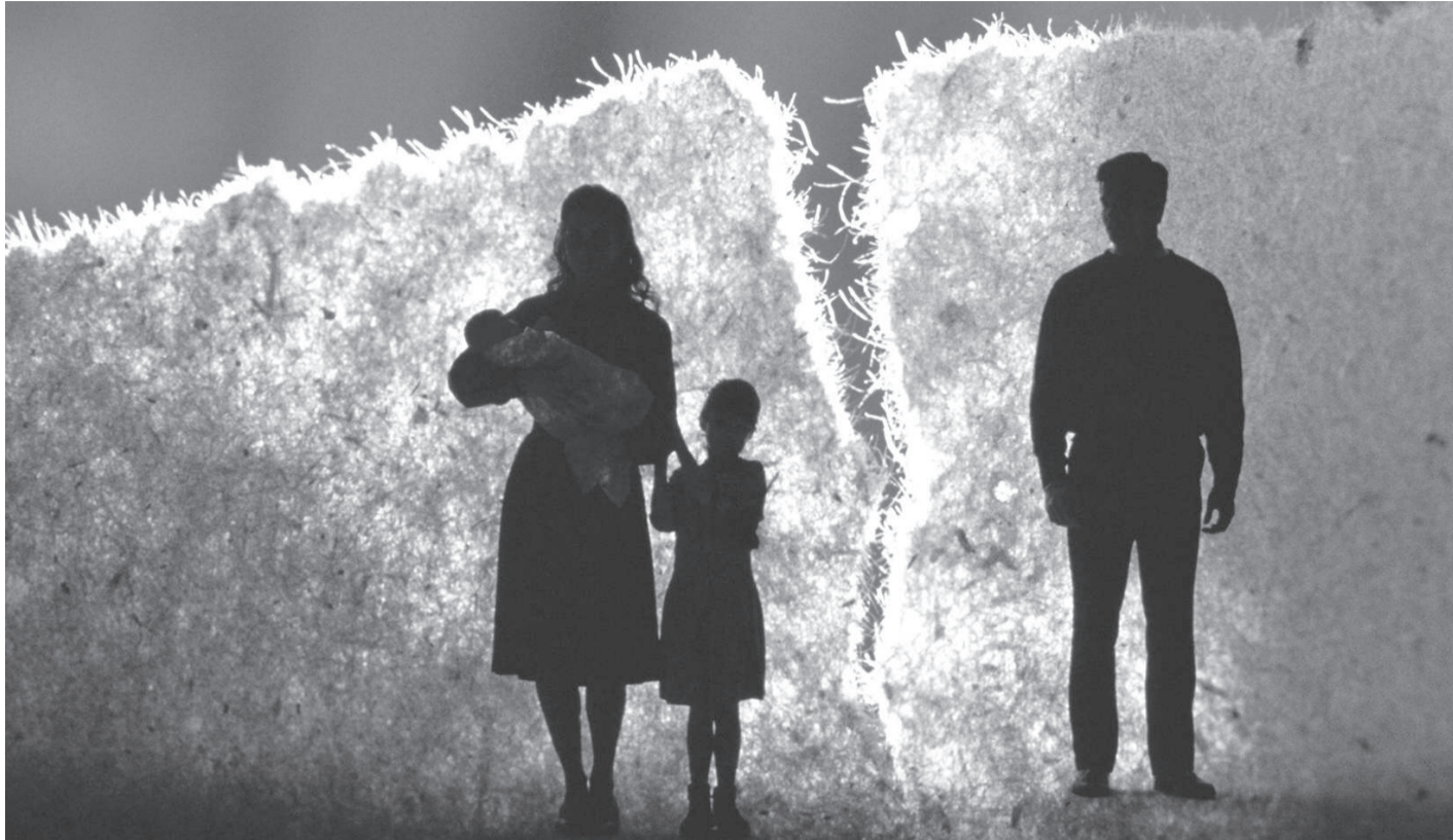
Сурет ашық, лицензиясыз

Тәуелсіз кеңесшінің айтуынша, әйелдерді тек бала туып, күнделікті тірлікпен