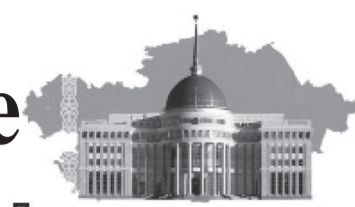
Президент тапсырмасын орындай отырып...