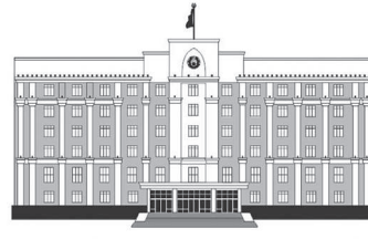
ҚАРАҒАНДЫ ОБЛАСЫНЫҢ ӘКІМДІГІ