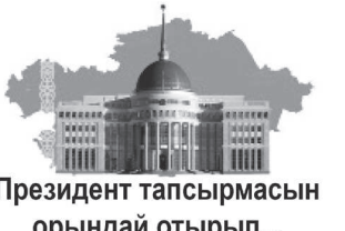
Президент тапсырмасын орындай отырып...

Жақында Ақтоғай ауданы Шашубай кентінде 96 отбасы баспаналы болды. Пәтер кілттері ұзақ жылдар үй кезегінде тұрған азаматтарға берілді. Қоныстайын тойлағандар қатарында мүмкіндігі шектеулі жандар, ата-ана камқорыссыз қалған балалар, көпбалалы отбасылар мен жалғызбасты азаматтар да бар.