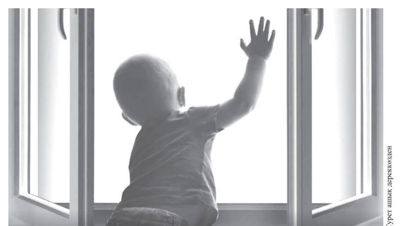
Сурет ашық дәреккөзінен