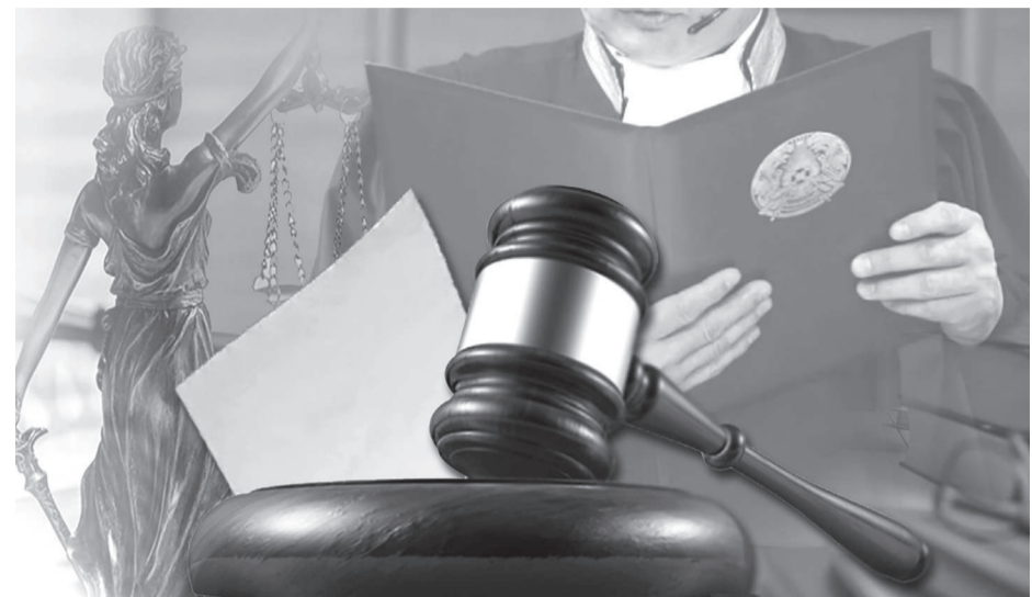
Сурет шаяқ. Корекованы

Президент Қасым-Жомарт Тоқаев «Қазақстан Республикасының кейбір заңнамалық актілеріне әйелдер құқықтары мен балалардың қауіпсіздігін қамтамасыз ету мәселелері бойынша өзгерістер мен толықтырулар енгізу туралы» Заңға қол қойды. Оған сәйкес, әйелдер мен балаларға қатысты зорлық-зомбылықтың кез келген көрінісі үшін жауапкершілік күшейтіліп, отбасы институтын, кәмелетке толмағандардың қауіпсіздігін нығайтуға арналған нормалар енгізіледі.