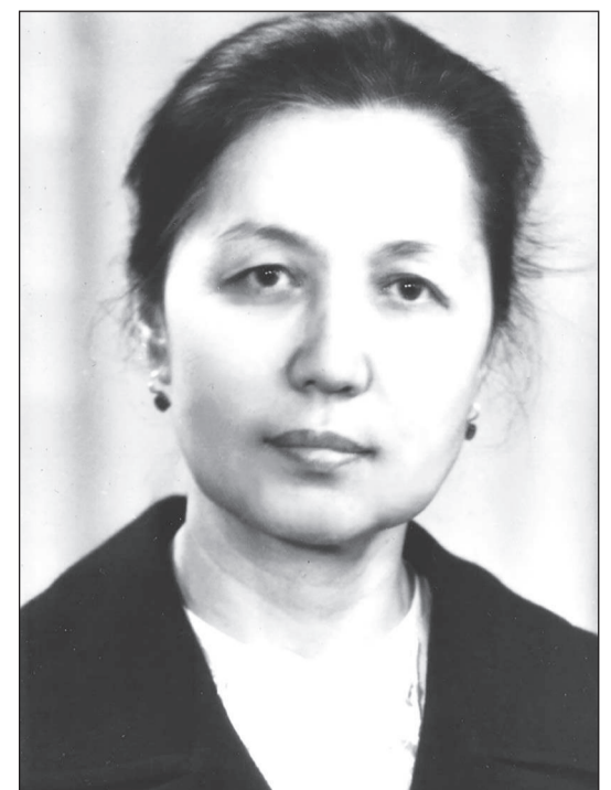
сып, көңiл айтамыз.

Мәпiш Шәрiпқызы туралы жарқын естелiк бiздiң жүрегiмiзде мәңгi сақталады.