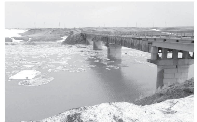
Сурет аймақ дереккерінің алаңында

– Су тасу қаупі жоғары аймақтар: Абай, Ақмола, Ақтөбе, Алматы, Шығыс Қазақстан, Батыс Қазақстан, Қарағанды, Қостанай, Солтүстік Қазақстан және Жетісу облыстары. Ал, орташа қауіп деңгейінде Атырау, Жамбыл, Қызылорда, Павлодар, Түркістан және Ұлытау облыстарында. Су тасқыны қаупі аз аймақ Маңғыстау облысы саналды. Жазық өңірлердегі қар қоры аз, алайда жазғы аймақтардың бүкіл жерінде күзгі ылғалдану шамдан жоғары болып тұр, – деді гидрологиялық болжамдар басқармасының бас-