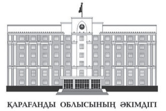
ҚАРАҒАНДЫ ОБЛАСЫНЫҢ ӘКІМДІГІ