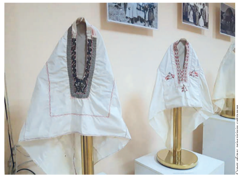
Сурет облыс әкімінің сарайынан

– Ең көне кимешектердің кейбірі ХІХ ғасырдың аяғына жатады. Оларды бізге өңіріміздің тұрғыны сыйға тартты. Олар – Семей губерниясының Тобықты руынан шыққан әжейте тиесілі болған. Бұл кимешектер жас әйелге арналған. Әйел бірінші баласын дүниеге әкелгеннен кейін кимешек киген. Ал, балалар туылғанға дейін ол өзінің ұзатылған кездегі бас киімі – сәукеле киген. Барлық кимешектер ақ түсті болады. Аза тұту кезінде де қалың қарашан ақ бас киім кететін. Ақ түс – қасиетті, бұл ана сүтіннің түсі, тазалық. Кимешектер шашты қорғауға, мойын мен иықты жабуға арналған, бірақ, әйелдердің беті арқашан ашық болатын, – дейді Қарағанды тари-