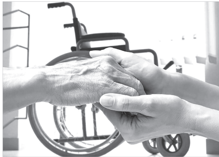
Сурет ашық дереккөзінен

Сол жылы хоспистер Павлодар, Қостанай және Қарағанды қалаларында да құрылды. Шірек ғасырға жуықта да, елдегі паллиативтік көмек көрсету мәселесі толығымен шешімін таппа-