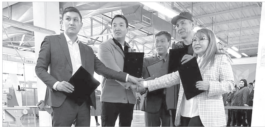
Сурет ашық дереккөзінен

Нарықта сұранысқа ие болу үшін бірлікті ту өткен Қарағанды облысының тігін кәсіпорындары алдағы уақытта елімізді отандық шикізатпен және жоғары сапалы маталармен қамтамасыз етуге бел буып отыр. Облыс әкімдігінің қолдауымен Шымкент қаласы және Түркістан облысының өндірісімен аймақаралық консорциум құру туралы шарт жасалды.