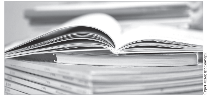
Сурет ашық дереккөзінен

катарында 3-сынып үшін «Еңбекке баулу», «Бейнелеу өнері», «Орыс тілі» (орыс тілінде оқытатын мектептер үшін), шет тілдері (ағылшын, француз) оқулығы бар. Сондай-ақ, 3,9-11 сыныптар үшін «Неміс тілі», 5-9 сыныптарға арналған «Жабандық құзыреттілік» оқулықтары қағаз нұсқада, 3-сыныпқа арналған «Дифрлық сауаттылық» пәні бойынша электронды оқулықтар талқыланады.