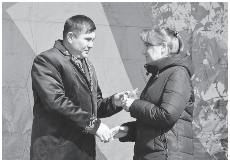
Сурет бұрынғы әкімнен

рылған. Толық жөндеу жұмыстары жүргізіліпті. Едені қапталып, қабырғалары сыланған. Біз тек көше саламыз. Үлкенім – 11 жаста болса, кейжеміз – алтыда. Балала-