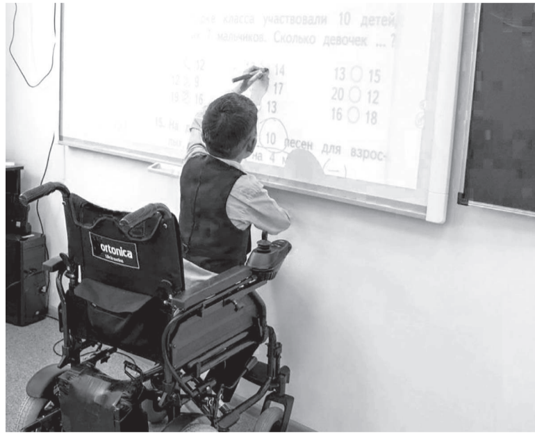
Сурет облыс әкімінің сайынынан

Басқарма басшысы инклюзивті тәжірибе бойынша оқулықтар мен әдістемелік құралдарды сатып алу