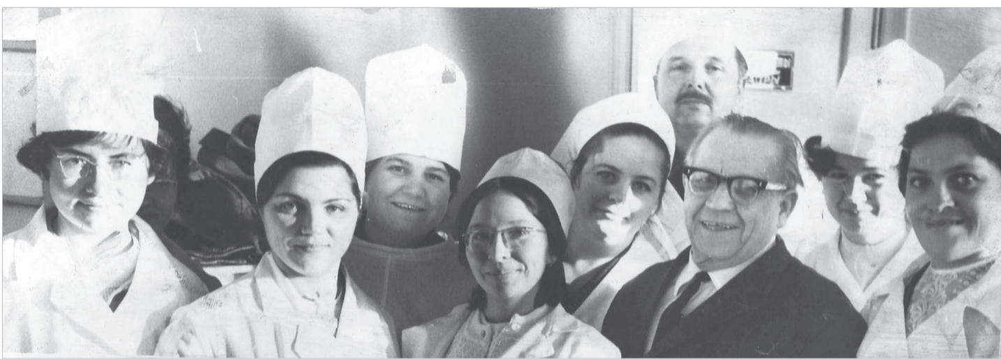
Кешкі бөлім студенттерімен бірге

1933-1950 жылдар аралығында қатардағы аурухана дәрігері, бөлім меңгерушісі, бас дәрігер, облыстық денсаулық басқармасының басшысына дейін көтерілді. Ал, 1950-1974 жылдары Қарағанды мемлекеттік медицина институтының ректоры қызметін атқарды. 70-тен астам ғылыми еңбектің авторы атанды.