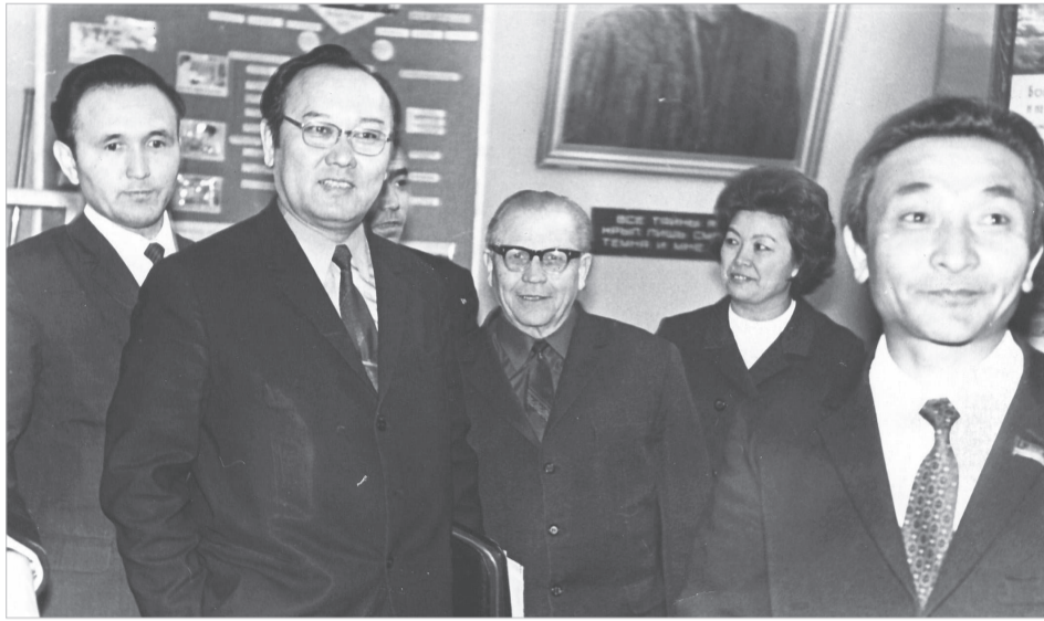
КММИ-ге ҚазКСР Денсаулық сақтау министрі Төрегелді Шарманов келгенде (оң жақта)

Ұлттық медицина кадрларын даярлауға ерекше талаппен қарады. Қазақтар арасында шексіз құрметке ие болды. Мәселен, 1950 жылы Қарағанды облысында қазақ дәрігерлер саны тек 8 адамды құрады. Ал, 1973 жылы Қарағанды мемлекеттік медицина институтына қабылданған 7 726 түлектің 2 184-і қазақтар еді. Осылайша саналы ғұмырын дәрігер мамандар даярлауға арнады.