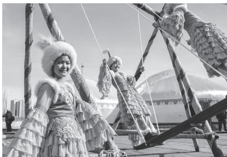
Сурет шығарушы: А. Аманжол

осы сөз қайталады. Содан соң кешкі шай үстінде көрші-қолаң бір-біріне кіріп, Наурыз көжені қай үйдің қашан дайындалғанын өзара келіседі. Содан 22 наурызда дейін таманмен тұрып, қазақы шапан-қамзолдарын киіп, кешке дейін бірінен соң біріне Наурыз көжеге бару басталады. Әр үйдің қазаны қайнап, дастарханы жайнап тұрады. Бала да, шаға да маз-мейрам. «Наурыз құтты болсын!», «Ақ мол бол-