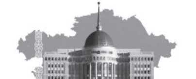
Президент тапсырмасын орындай отырып...

Соған байланысты, 2024 жылдың 5 наурызында жұмыс орыны қамдап, сайлау мақсатында 400 мың теңгенің жабдыктарын сатып алудың шығындар сметасы бекітілген. Осыдан кей-