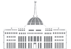
Реформа – өміршең өзгерістер