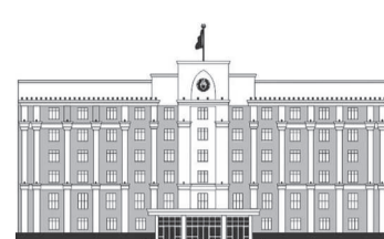
ҚАРАҒАНДЫ ОБЛЫСЫНЫҢ ӘКІМДІГІ