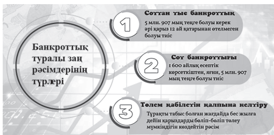
Инфографика жасалып А. Рахымжан

Данияр Берікұлы көрсеткен екінші рәсім – сот банкроттығы. Бұл жағдайда да тұрғындардың қарызы 2024 жылы 1 600 айлық есептік көрсеткіштен, яғни, 5 млн. 907 мың теңге болуы тиіс және кредиторлар алдындағы борыштардың барлық түрлері бойынша қолданылады. Бірінші рәсімнен айырмашылығы – борышкердің мүлкі сауда-саттықта түсетінінде. Яғни, кредиторлардың қарыздары банкрот болған адамның мүлкі есебінен жабылады.