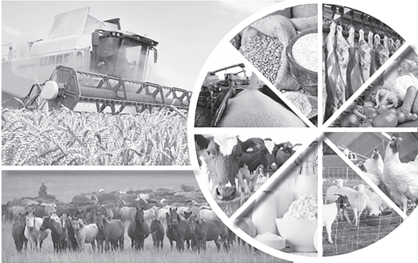
Коллаж: Александр М. Обинов

иеленген, атакты ғалымы Ж.Алферов: «На словах власть заботится о научном потенциале государства, но на деле положение такое, что наукой могут заниматься сегодня только негосударственные оптимисты», «много слов произносится об экономике, основанной на знаниях», инновационном этапе развития, увеличении «результативности» научных исследований, но в реальности происходит с точностью наоборот», «из всего этого