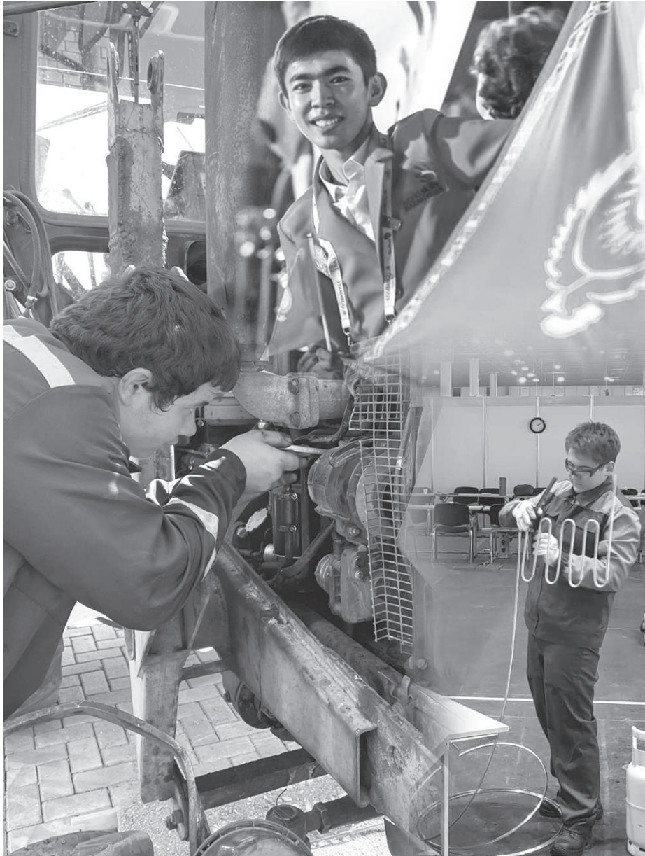
Колледжде жасалып жатқан жұмыс

Бүгінгі таңда 6 колледжде 8 жаңа мамандық пен 9 біліктілік ашылған. Атап айтсақ, «Цифрлық технология», «Дене шынықтыру және спорт», «Автомобиль көлігіне техникалық қызмет көрсету, жөндеу және пайдалану», «Құрылыс және ғимараттар мен құрылыстарды пайдалану»,