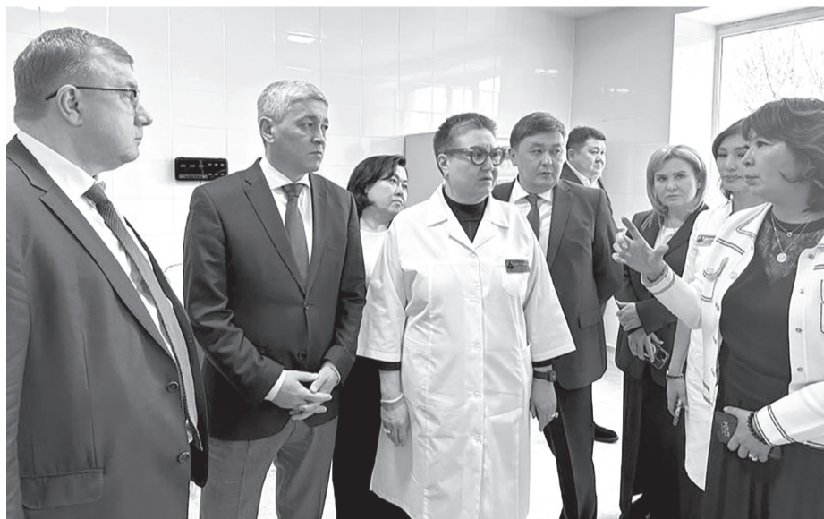
Сурет облыстық онкология орталығында

– Радиациялық онкология орталығы әртүрлі ісіктерді емдеу үшін заманауи