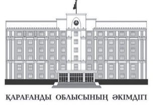
ҚАРАҒАНДЫ ОБЛАСЫНЫҢ ӘКІМДІГІ