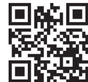
Газет жеткізілмесе 41-26-82, 43-57-88 телефонына хабарласыңыздар.