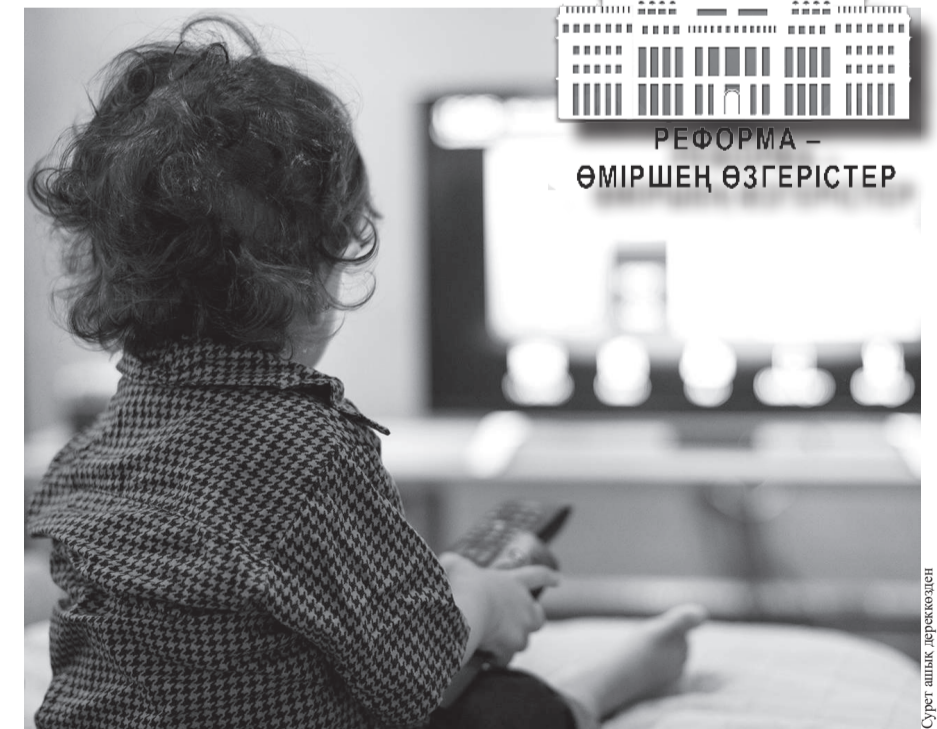
Сурет шық. ақпарат

Логопедтің айтуынша, баламен сөйлесіп, көңіл бөлу керек.