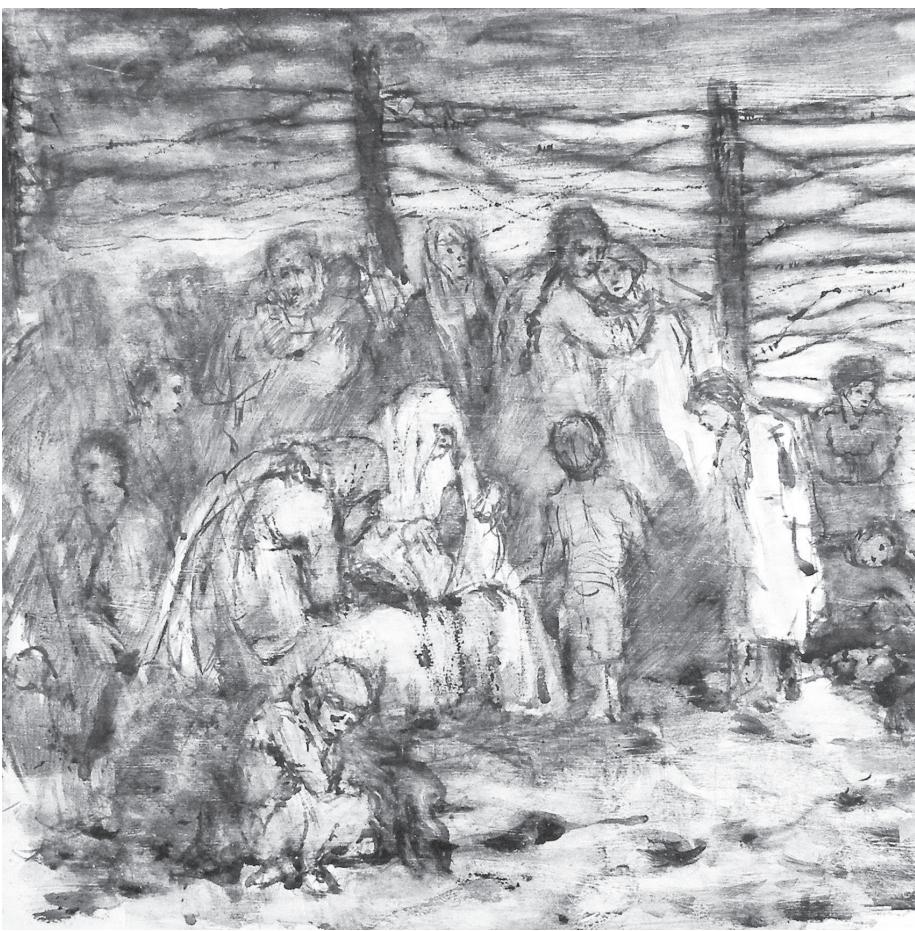
Сурет ашық жермен

Шұбар бұдан соң да бірнеше рет кезікті. Өрбір кездескен сайын әңгіме бастауға тырысады. Бірақ, Дәрияш одан үн-түссіз жылыстап құтылады. Бұдан соң көрші келіншек те келуін тоқтатты. Оның ессесіне