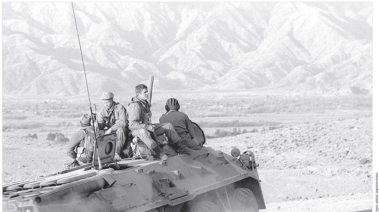
Сурет ашық дереккөзінен