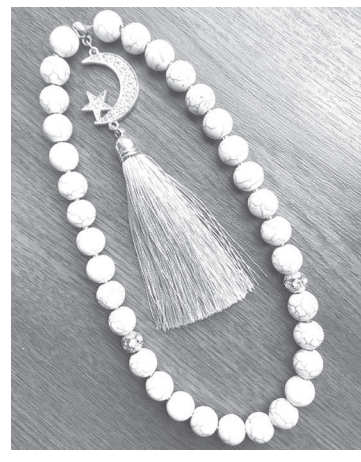
Сурет ішкік дерекөзінен

– Жамағаттарымыздың саны артып келеді. Жұма намаздарда мешітке сыймай қалатын кездері де бар. Сондықтан, жаңа мешіт қажет деген пікірдеміз. Әрі оның шағын болғаны да дұрыс. Өйткені, мешіт өз шығындарын толықтай өзі өтейді. Үлкен мешіттің коммуналдық шығындары көп болатынын білесіздер. Ұстап тұру қиын.