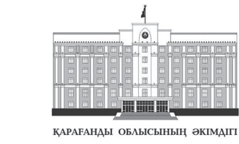
ҚАРАҒАНДЫ ОБЛЫСЫНЫҢ ӘКІМДІГІ

Сіздердің жұмыстарыңыз қоғам үшін өте маңызды. Соңғы борандар мұны дәлелдеді. Өмірді құтқару, төтенше жағдайлардың алдын алу – басты міндет. Сондықтан, республикалық және облыстық бюджеттер есебінен жыл сайын арнайы техниканы жаңар-