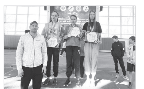
Дайындаған Жәлел ҚУАНДЫҚҰЛЫ, «Ortalyq Qazaqstan»

Жеңімпаздар мен жүлдегерлер кубок және ақшалай сыйлық иеленді.