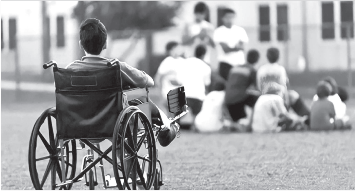
Сурет шық. лерекөзден