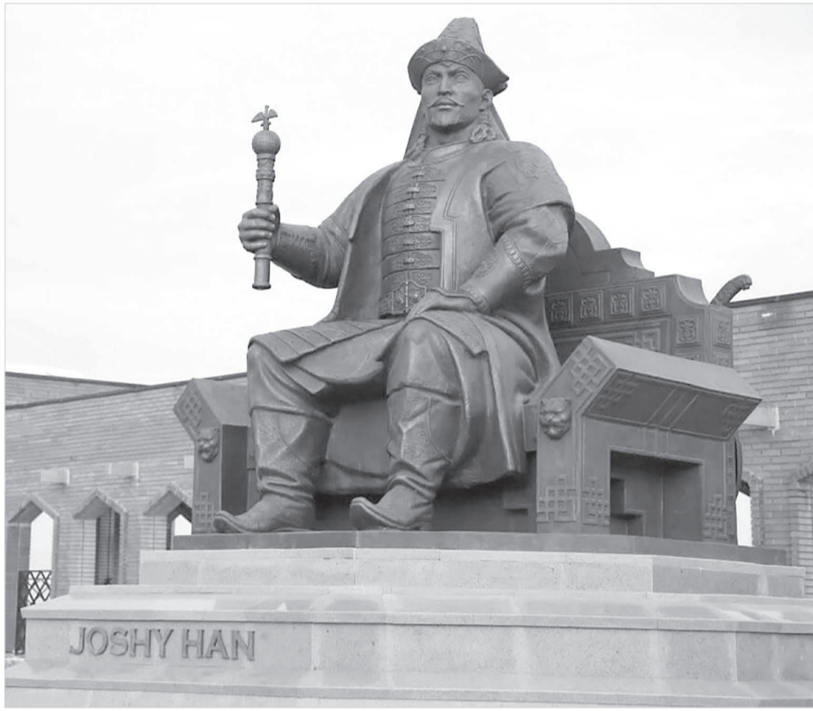
Сурет: Шыңғыс ханның әулеті

Сөйтіп, Алтын Орда тағына Бату отырды да, оның әулеті қашан өз әкесі Әз Жәнібекті өлтіретін «Нар мойны» кесілген Бердібек ханға» (1357-1359 ж.ж.) дейін 6 ата бойы билік құрып мүлдем үзіледі. Бату (1227-1255 ж.ж.), Берке (1257-1266 ж.ж.), Мөңке Темір (1266-1280 ж.ж.), Туда Мөңке (1280-1287 ж.ж.), Төле бұғы (1287-1291 ж.ж.), Тоқты (1291-1312 ж.ж.), Өзбек (1312-1342 ж.ж.), Әз Жәнібек (1342-1357