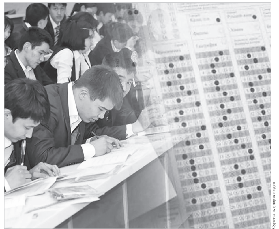
Сурет шық. лерекөзден

Тест тапсырушыларға тестілеу аяқталғаннан кейін 30 минут ішінде апелляцияға өтініш беруге мүмкіндік бар. Сертификат апелляциялық комиссияның шешімінен кейін талапкердің жеке кабинетінде қолжетімді.