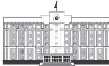
ҚАРАҒАНДЫ ОБЛАСЫНЫҢ ӘКІМДІГІ