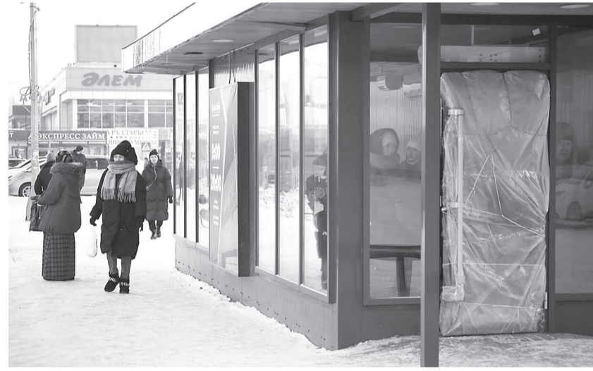
Сурет ашық перспективаның аялдамасы

Быттыр облыс орталығында жаңадан 14 жылы автобус аялдамасы орнатылған болатын. 14 аялдаманың 8-і – Қазыбек би ауданына тиесілі. Бірақ, тұрғындар олардың сапасы сын көтермейді деп шағымданады. Бірінде жылыту құрылғылары жоқ болса, бірі – қаңғыбастардың тұрағына айналған.