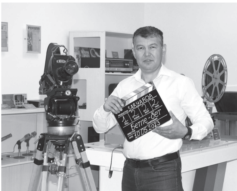
Суретте: Қаршыға ИГЕН

– Сценарийді өзім жаздым. Кейінгі уақытта театрдағы режиссерлермен, сценаристтермен ақылдасып жүрмін. Кейін-