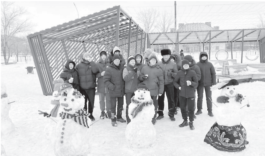
Сурет облыс әкімінің сайынан

Кейінгі жылдары Саран шаһары құлшырып келеді. Қала тұрғындарының белсенділігі мен ұйымшылдығы сырт көзге сүйсінерліктей. Жуырда шаһар орталығында өткен «Үздік аққала» байқауы сөзімізге дәлел. Байқауға 250-ге жуық адам қатысқан. Сайыстан соң қаладағы «Сұңқар» стадионында 80 көңілді қар адамынан тұратын тұтас аллея пайда болған.