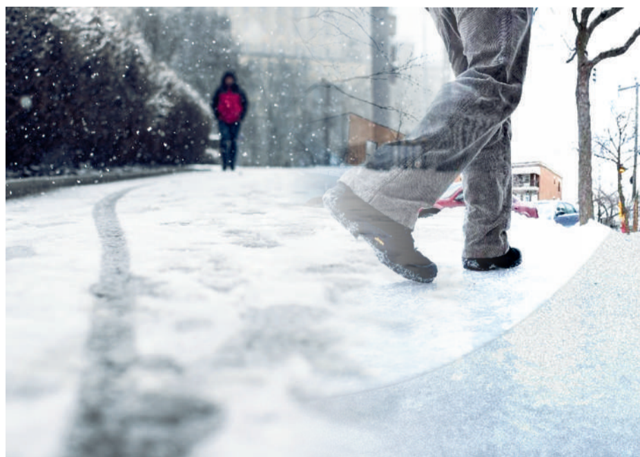
Сурет ашық әрекеттен

Байыптап қарасаңыз, тұрғындар пікірі сан алуан. Оның үстіне кейінде жеткен бұрқасын, қалың қар, тұман қозғалысты мүлде тежеп тастағандай. Қаладағы көктайғақ жазатайым оқиға мен тосын апатқа ұшыратуы мүмкін. Тұрғындар мен жүргізушілер жаяу жүргіншілер жолы мен жолдарда сырғанау қаупіне тап болады.