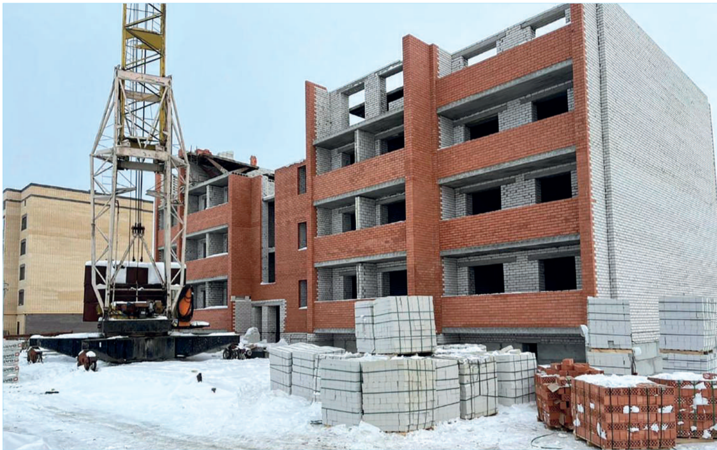
Сурет ашық әрекеттен

Аймақта заңсыз салынып жатқан тұрғын үй кешендерінің тізімі, оларды салушы құрылыс компанияларының аты былтыр көктемнен бастап айтылған болатын. Сол уақытта-ақ мемлекеттік сәулет-құрылыс бақылау басқармасы тұрғындарға олардан пәтер сатып алудан сақ болуға кеңес берілген-ді. Бүгін шу болып жатқан «Хан» да, «Al-Farabi» да сол «қара тізімде» бар. Қоғамдық резонанс тудырып, нәтижесінде заң талабына адами факторды қарсы қойды. Себебі, жергілікті биліктің үлескерлерді қолдайтынын және қорғауға барын салары бесенеден белгілі. Құрылыс компаниялары құжатының дұрыс емесін біле тұра әрекет етіп, өзгеге заңды осылай белшеден басуға болады деп көрсетіп отырғандай.