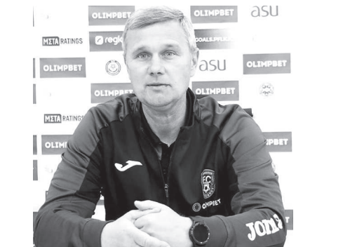
Дайындаған Жәлел ҚУАНДЫҚҰЛЫ, «Ortalyq Qazaqstan»

Солошенко ойыншы ретінде көптеген жылдар бойы премьер-лигада өнер көрсеткен. Кейін «Шахтер» клубының спорт директоры болып қызмет етті. Сонымен қатар, «Шахтер-Болат» бірінші лигасын басқарған.