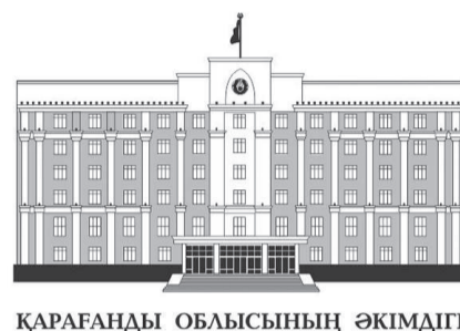
ҚАРАҒАҢДЫ ОБЛЫСЫНЫҢ ӘКІМДІГІ

Аймақ басшысы Ермағанбет Бөлекпаев жана форматта облыс орталығындағы үлкен ХҚКО-да халықпен кездесті. Жалғыз өзі ғана емес, басқарма мен ведомство басшылары да осы арадан табылды. Бұл – бұған дейін өңірдің барлық қала мен ауданында өткен 25 кездесудің қорытындысы. Бұл жолы 6,5 сағатқа созылған кездесу рекордтық көрсеткішке ие болды. Президент Қасым-Жомарт Тоқаевтың әкімдердің халықпен кездесуі туралы арнайы Жарлығында жазылғандай, халық талап етті, әкім уақытпен санаспай тұрғындарды қабылдап, сұрақтарына жауап берді. Ал, кездесуге келгендердің 89-ы облыс әкімінің өзіне жүгінді.