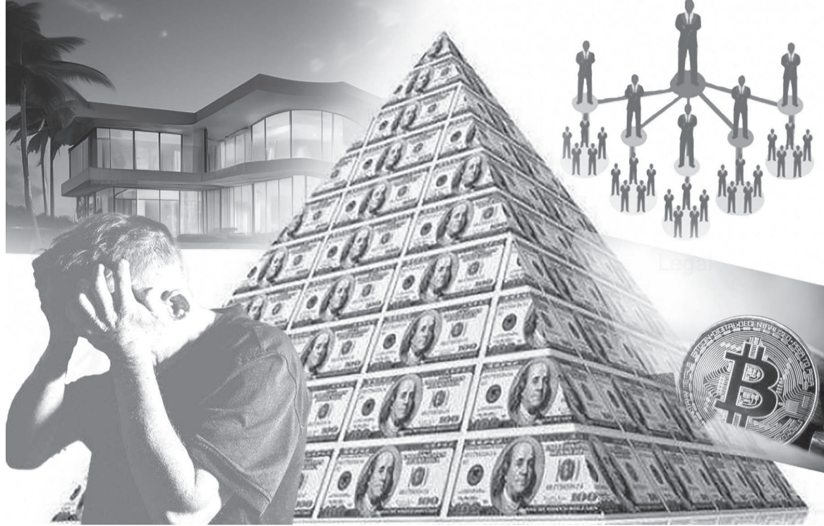
Коллаж жасаған Айбек Рахымжан

Сонымен қатар, қаржы пирамидаларында келісім-шарт болмайтынын, бола қалған күнде ол барлық тәуекелдер клиенттің өзі-