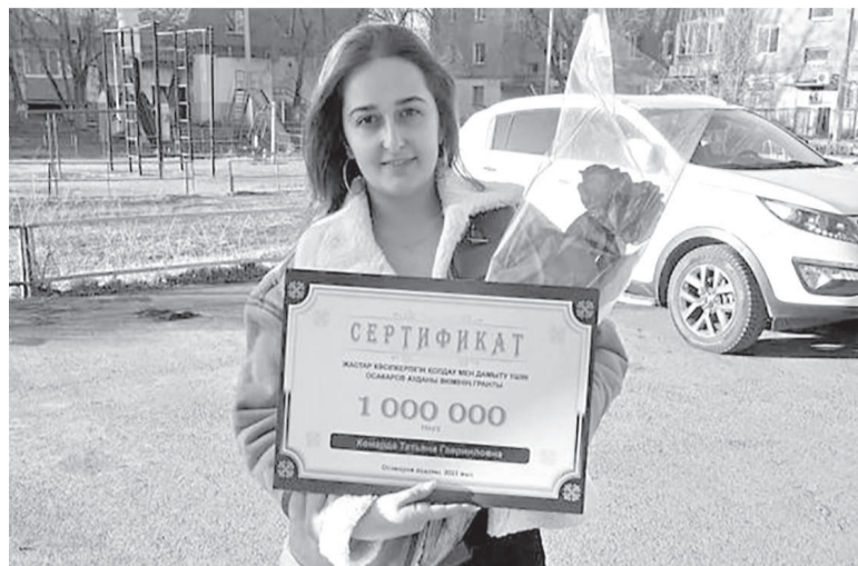
Сурет обьекте аккредитация сыйлығы

– Бұл грант маған қазір жұмыс істеп тұрған бизнесімді кеңейтуге қажет болды. Менде кинокафе мен