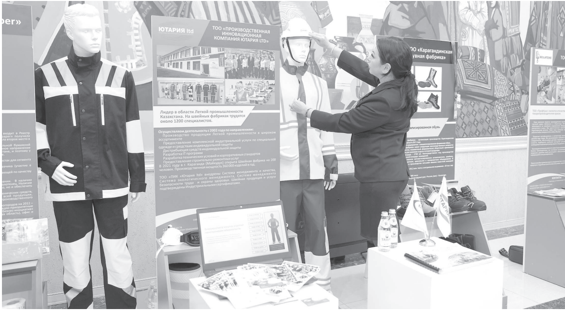
(Соңы. Басы 1-бетте)

Ауыл шаруашылығы өнімінің көлемі бойынша республикада алдыңғы қатардамыз. Жұмыртқа өндіруден үшінші, картоп өндіруден төртінші, сүттен жетінші орындамыз. Біздің өндірушілер облысты ғана емес, басқа да өңірлерді азық-түлікпен қамтамасыз етуде.