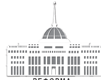
РЕФОРМА – ӨМІРШЕҢ ӨЗГЕРІСТЕР

Иә, рас, Ақтоғайдағы шалғай ауылдарда ауыз су мәселесі әлі де өзекті. 2025 жылға дейін барлық елді мекендерді орталықтандырылған ауыз су жүйесімен қамтуды жоспарлап отыр. Бүгінгі күні