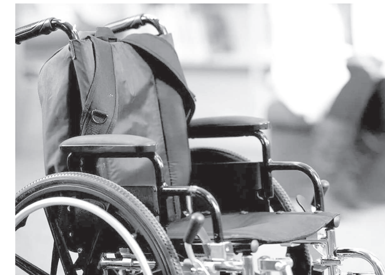
Сурет шәкілдер көзінен

нитарлық алғашқы көмек ұйымы бар, оның 13-інде емдік дене шынықтыру кабинеттері ашылды. Сондай-ақ, анестезиологиялық құралдармен МРТ (маг-