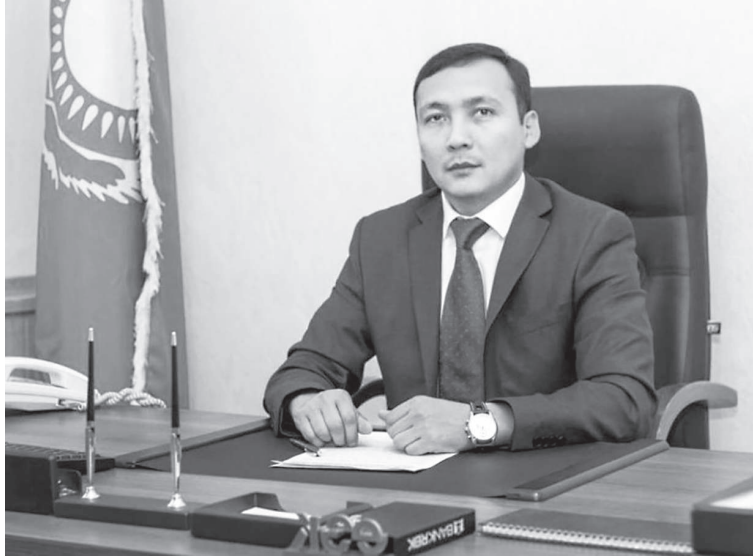
Сурет ашық әрекеттен алынған

– Ауданға инвестиция тарту, тау-кен өндірісін дамыту бағытында ауқымды шаралар атқарылғалы тұр. Былтыр бастау алған «Ирқаз Металл Корпорациясы» ЖШС «Борлы» кен орнында катодты мыс өндіретін гидротал-лургиялық зауыттың құрылысы 9,0 млрд. теңгеге іске қосылып, 125 адам жұмыспен қамтылды.