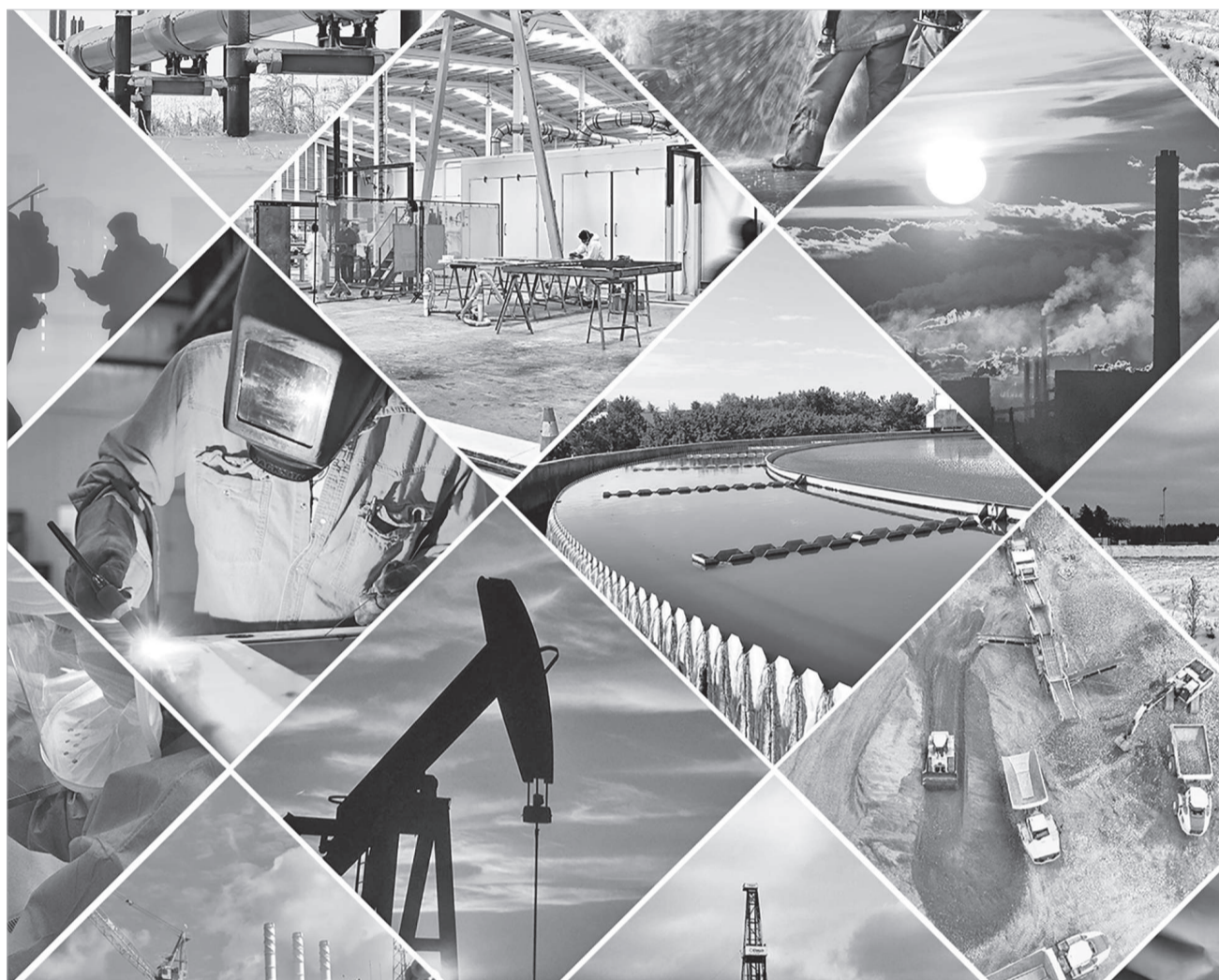
Сурет ашық жерлермен алынды

Мақұл делік. Көрсеткіш көз сүйсінткенмен, алдағымызды саламат ету жолында экономиканы екпіндетіп, әртарапандыра түсу міндетін ешкім жоққа шығарған жоқ. Тоқталайық.