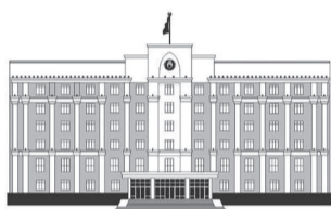
ҚАРАҒАНДЫ ОБЛЫСЫНЫҢ ӘКІМДІГІ

маған көмек сұрап келген жоқ, – деген аймақ басшысы Костенко шахтасында орын алған апатта қаза тапқан кеншілер отбасына