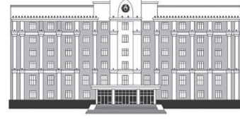
ҚАРАҒАНДЫ ОБЛАСЫНЫҢ ӘКІМДІГІ

Республика күні қарсаңында аймақ басшысы Ермағанбет Бөлекпаев кезекте тұрғандарға жаңа пәтер кілттерін табыстады. Мерекедегі тосынсыз көпбалалы отбасыларға, балалар үйінің түлектеріне және ата-ана қамқорлығынсыз қалған балаларға бұйырды.