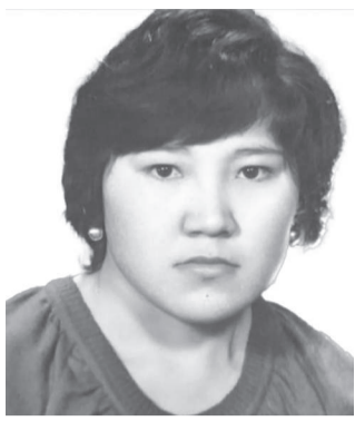
өмір сүруіңізді тілейміз.

Алтын күнім, жарқын нұрым, жұмағым. Саркылмайтын, балдай тәтті бұлағым. Ұрпағына деп арнаған ғұмырым, Ұзақ болсын – Тәңірімнен сұрарым.