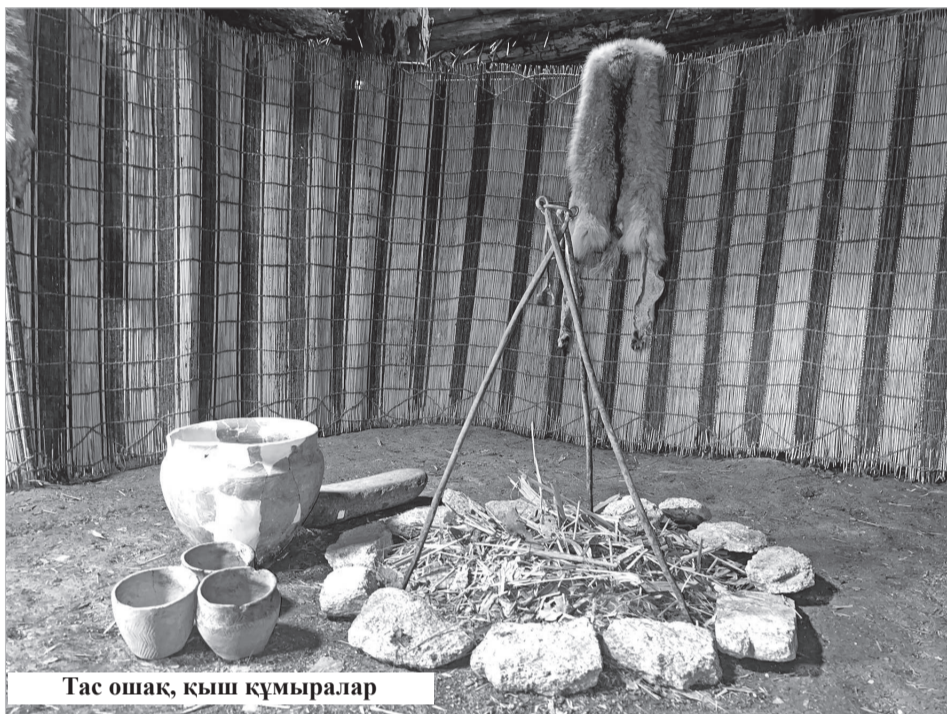
Тас ошак, қыш құмыралар