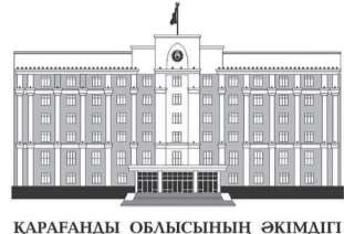
ҚАРАҒАНДЫ ОБЛАСЫНЫҢ ӘКІМДІГІ