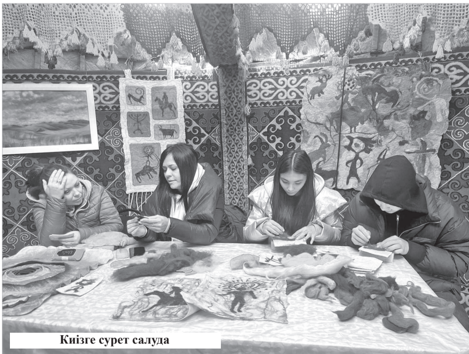
Киізге сурет салуда