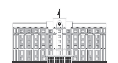
ҚАРАҒАНДЫ ОБЛЫСЫНЫҢ ӘКІМДІГІ

– Дуальды жүйе атауы қоғамға кеңінен таныс болғанымен, іс жүзінде көбісі түсіне бермейді. Жүйе еңбек нарығындағы өзгерістерге тез бейімделетін, бәсекеге қабілетті, білікті мамандар даярлауды көздейді. Ол жұмыс берушілер мен кәсіптік маман даярлайтын оқу орындары арасында жүзеге асады. Өндірістегі сабақтардың өткізілуін, студенттердің қауіпсіздігін топ жетекшісі қадағалайды. Дуальды оқыту жүйесіне жауапты колледждің өндірістік