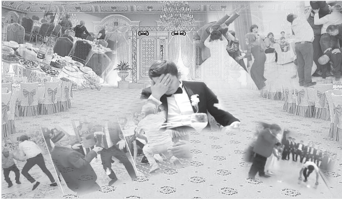
Коллаж жасаған Айбек Рахымов

Қарияларымызға осы сұрақты қойып ек, «заманның ағымы сол» деген жауап алдық. Бірақ, заман дегенімізді жасайтын – адамның өзі ғой. Біздіңше, бұл буынның ой, өресін жылдам, әрі арзан ақпарат пен бос күлкі көмген әлеуметтік желідегі сапасыз «контент» жаулаған. Бүгінде адамның айнымас серігі – смартфон. Оған даңғырлаған эстраданы қоссаңыз. Бір әнді жаттап үлгермей, келесі күні басқасы шығып жатады. Көбі – той