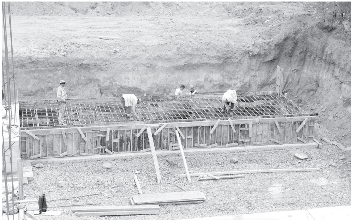
Ауыл шаруашылығы техникасы өтетін арнайы көпірдің құрылысы

– Жол бойында жүргеніме бес жыл. Әуелі жөндеу жұ-