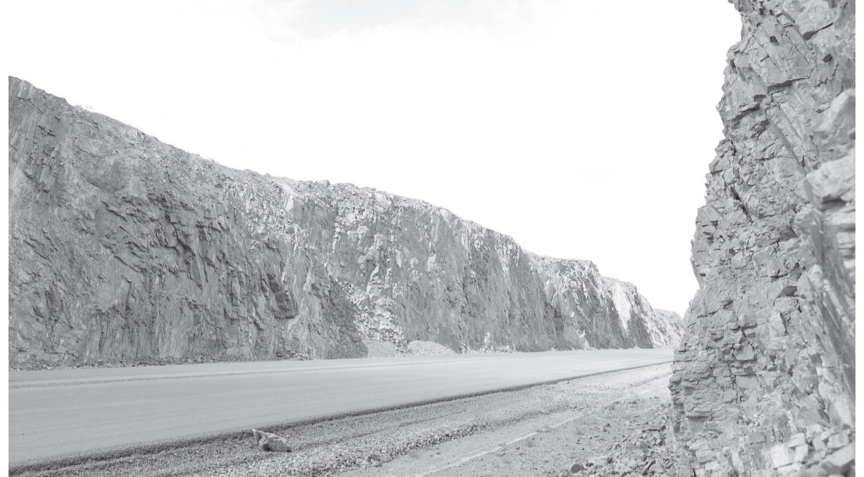
Биіктігі 15 метр болатын дөңді қак жарып, күре жол салынған сәт

гін тұрғызу үшін жерге қада қағылған. Бір бағыты былтыр қолданысқа берілген. Қада қағылған соң қаққалары салынып, үстінен бетон құйылады. Бетон қатқаннан кейін оны тегістеп, іргетасы құйылады. Әрі қарай басқа құрылымдары кезекпен іске асады.