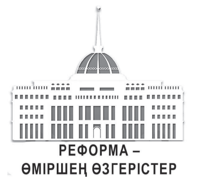
РЕФОРМА – ӨМІРШЕҢ ӨЗГЕРІСТЕР

Заманауи қондырғылармен жабдықталған зауыттың бұйымдары 100 пайыз дәлдікпен шығады. Өйткені, зауытта Қазақстандағы СББ станоктардың ең ауқымды паркі бар. Озық технологияларды, құралдарды және виртуалды ортада өңдеуді толық модельдеумен компьютерленген конструкторлық-технологиялық өнімдерді пайдаланып, механикалық өңдеудің кең ауқымын қамтитын әмбебап үлгідегі импорт алмастыратын ірі машина жасау кәсіпорны. Зауыт өңдеудің барлық кезеңдерінде Renishaw датчиктерін пайдаланып, станок-