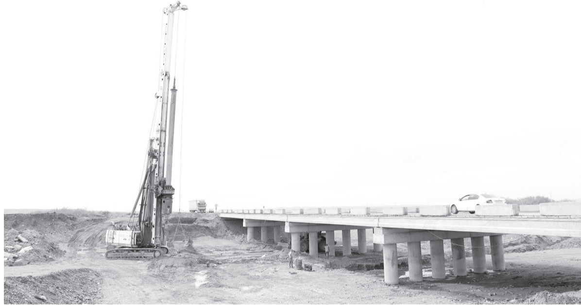
Нұраталды өзенін арнасынан бұрып, көпірдің екінші бөлігін тұрғызу үшін жерге қада қағылып жатқан сәт

Шетке дейін екі ірі дөңді жарып, ортасынан жол салған. Біріншісі, бірінші учаскедегі Спассккінің маңайындағы дөң болса, екіншісі Ақсу-Аюлы ауылына таяу тұста. Ауылдан шамамен 10 шақырым