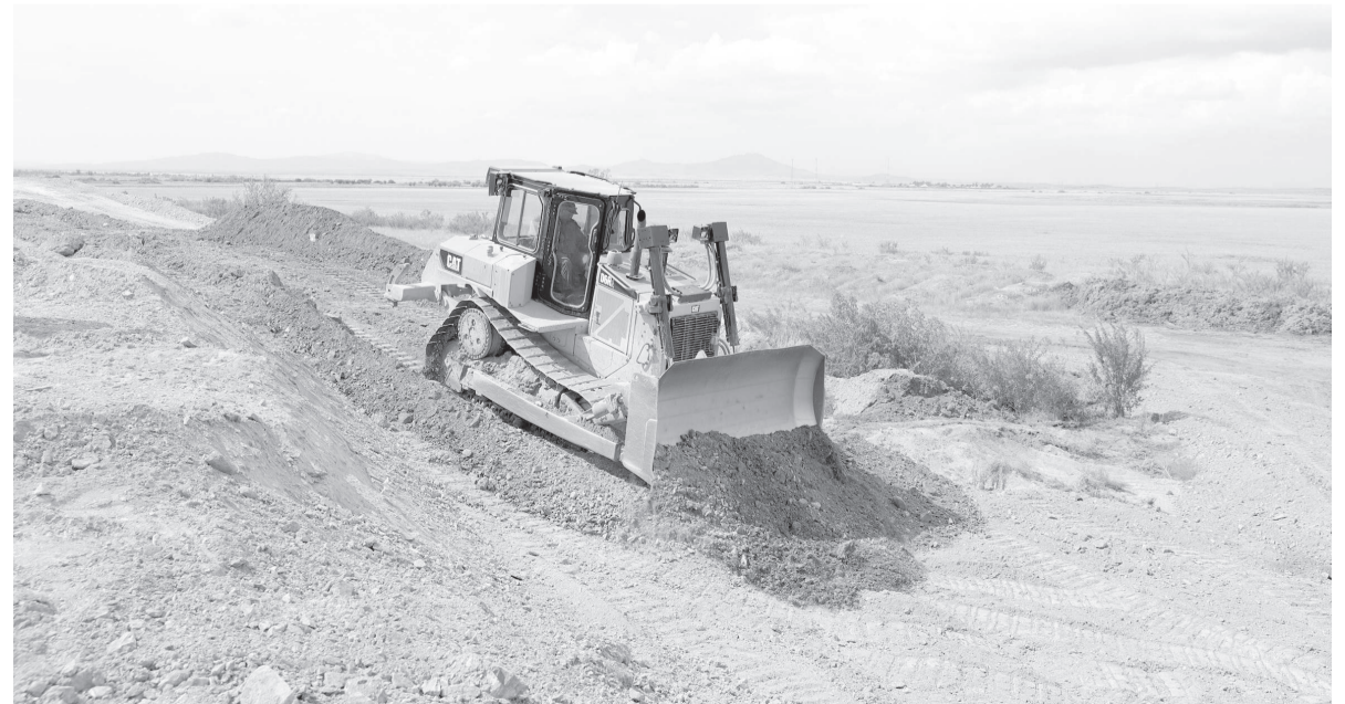
Америкалық Cat «D6R2» маркалы бульдозері

– Жол сапалы болса, жолаушы азап тартпайды. Бірақ, кейбір мекемелер технологияны сақтамайды. Мәселен, жаңа салынған асфальт уақыт өткеннен кейін шашылып қалып жатқанын көреміз. Себебі, технологиясы дұрыс емес. Мысалы, асфальтты нығыздайтын көлік шарт бойынша сол жерден сегіз мәрте өтуі шарт. Ол болса, төрт мәрте ғана жүріп өтеді. Салдарынан асфальт дұрыс тығыздалмай, көлік ағымына шыдас бермейді. Сондықтан,