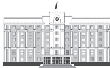
ҚАРАҒАНДЫ ОБЛЫСЫНЫҢ ӘКІМДІГІ

Кеншілер өлкесіне АҚШ-тың Қазақстандағы Төтенше және Өкілетті Елшісі Дэниел Розенблум танысу сапарымен ат басын тіреді. Аймақ басшысы Ермағанбет Бөлекпаевпен облыстың экономикалық ахуалы, білім беру саласындағы ынтымақтастықты дамыту мүмкіндіктері жөнінде әңгіме өрбтті.