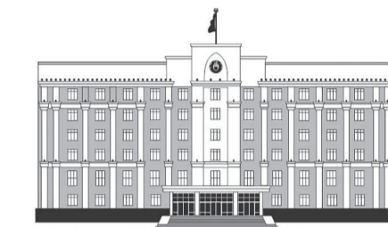
ҚАРАҒАНДЫ ОБЛЫСЫНЫҢ ӘКІМДІГІ

Ал, Нұра ауданында бір дала өрті тіркеліп, уағында ауыздықталған. 56 жану ошақтары оқшауланды. Дала жұмыстары-