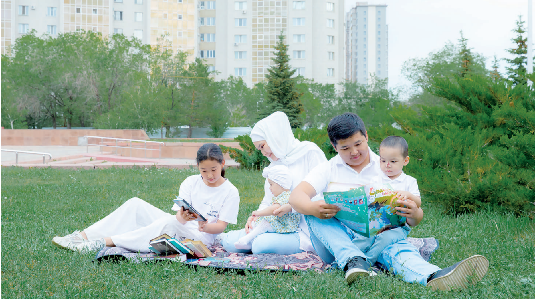
Фотоэтиді түсірген Жангелді Әбіғалым