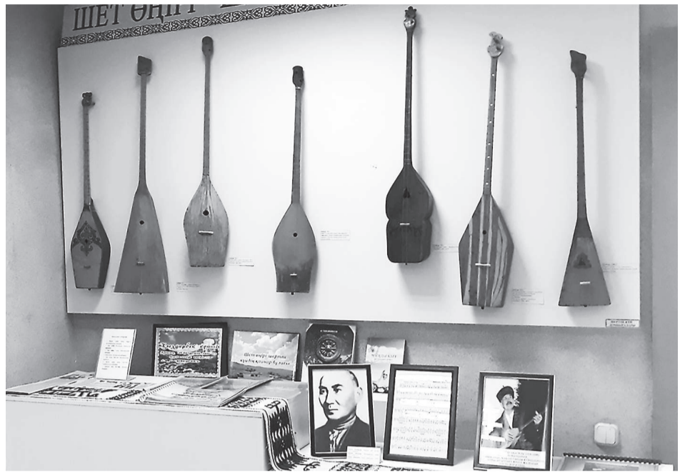
Атақты күйшілердің жеті домбырасы

Шет аудандық археологиялық-этнографиялық музей қорында өзімізге, елімізге танымал, өнер тарихында есімдері алтын әріптермен жазылған тұлғалардың домбыралары сақтаулы.