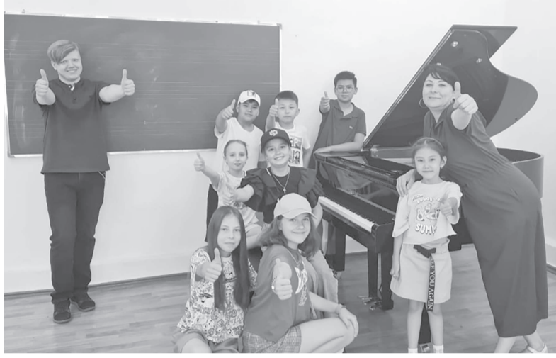
Сондықтан, оқушылардың бос уақытын дұрыс пайдалануға бағыт-бағдар берудің мәні зор.

Жазғы демалыс – мектеп оқушыларының табиғатпен ерекше үндестік тауып, дүниетаным аясы кеңіп, көзқарасы қалыптасып, ықыласы артатын жылдың тамаша мезгілі.